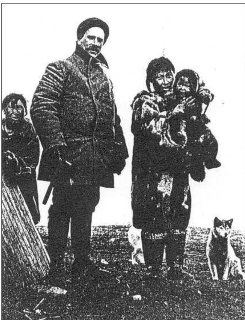
Рис.2. В.Вандерлип на севере Камчатки, 1900 г.

В 1920 г. гражданин США Вашингтон Б.Вандерлип (рис. 2) от лица американского правительства начал вести переговоры с Советским правительством о передаче Камчатки во временное владение с правом организации там концессионной деятельности по разработке и добыче угля, нефти и других полезных ископаемых. По истечении 60 лет, весь полуостров с концессиями должен был перейти во владение Советской Федерации (Ленин, 1964).