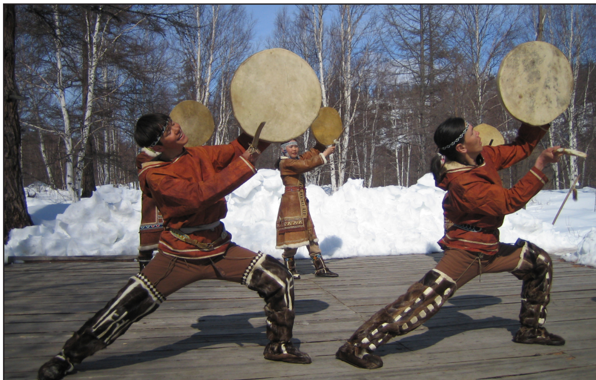
Рис. 2. Самобытная культура малочисленных народов Севера Камчатки – ресурс этнографического туризма. Танцует эвенский ансамбль из села Анавгай

Развивается на Камчатке и спортивная охота . Для любителей-охотников представляется возможность получить охотничьи трофеи в качестве крупнейшего медведя в мире – камчатского бурого медведя, лося, снежного барана, северного оленя, ряда водоплавающей и боровой дичи. Флора и фауна Камчатки вызывают огромный интерес у многих ученых мира, что способствует развитию научного вида туризма .