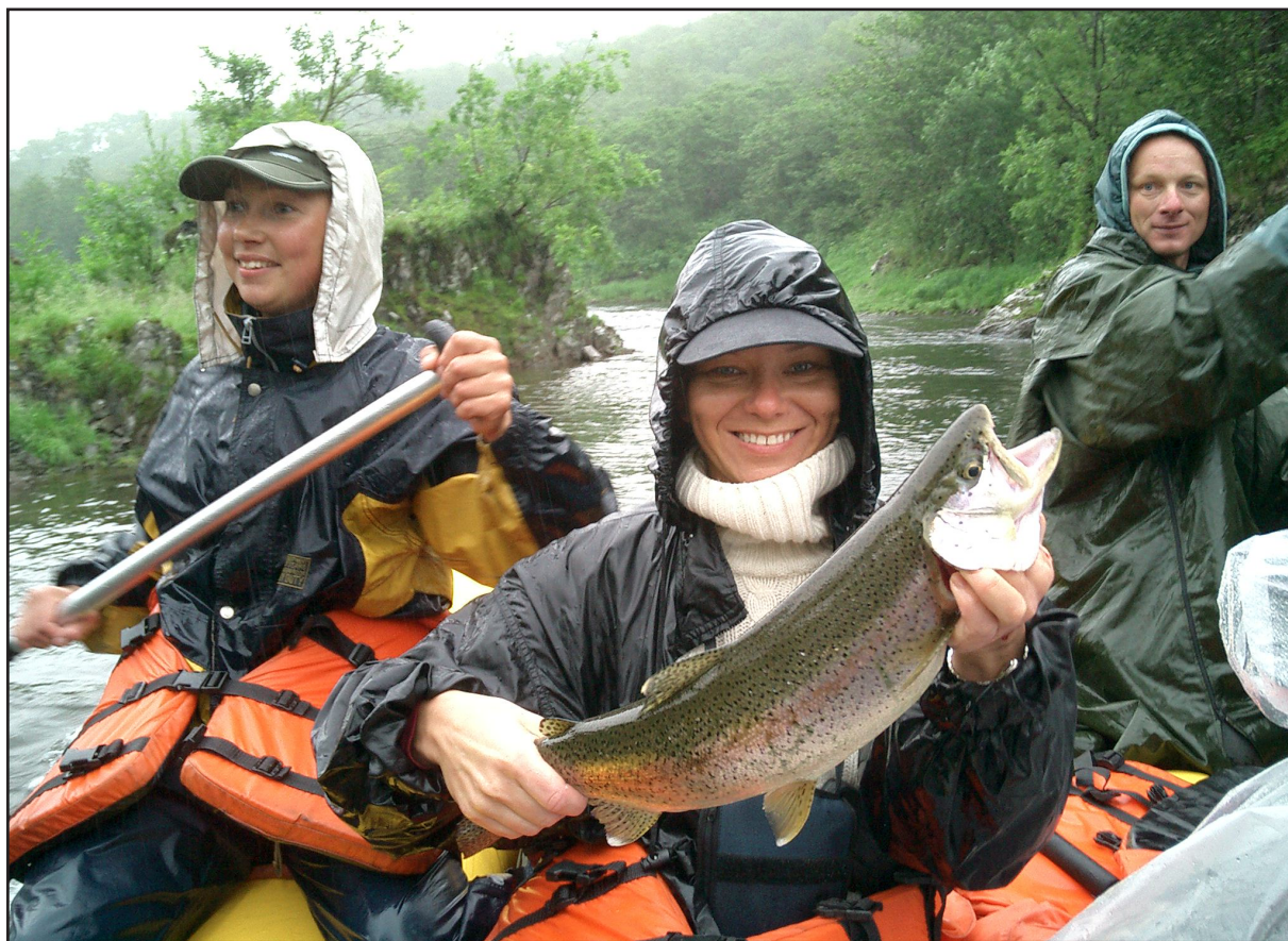
Рис. 1. На сплаве по реке Большой

Полуостров Камчатка интересен не только своей живописной природой, но и богатым историческим и культурным наследием (рис. 2). Экспозиции, созданные в музеях, памятники и памятные места Камчатки рассказывают об истории открытия, заселения и освоения камчатской земли. На территории полуострова зарегистрировано более тысячи памятников истории и культуры, 11 из них имеют федеральное значение.