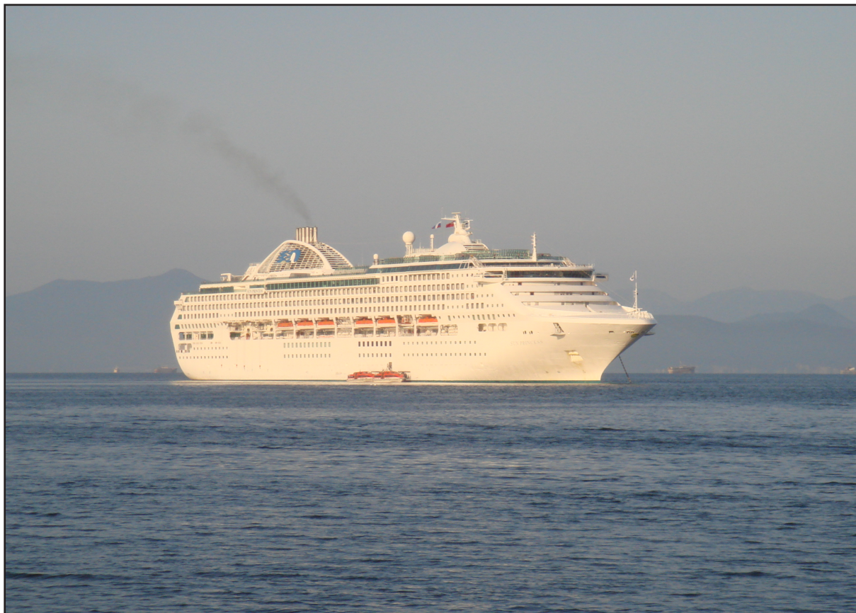
Рис. 4. Крузизный лайнер в Авачинской бухте