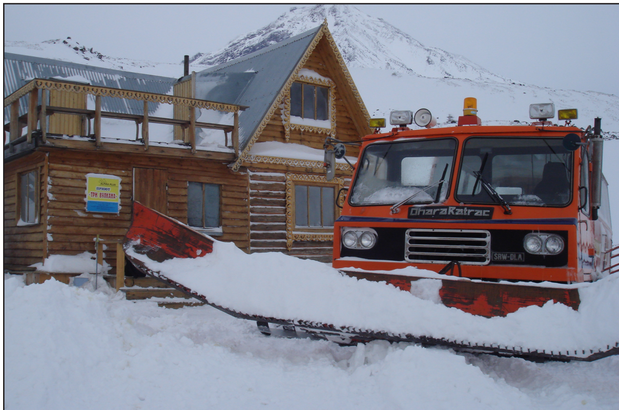
Рис. 6. Туристический приют на Авачинском перевале

стиницы в районах края, например «Биг-Ривер» (Усть-Большерецкий район) и др. Продолжают строиться и благоустраиваться базы-кемпинги в самых живописных местах, в охотничьих угодьях и местах спортивных рыбалок для туристов, охотников и рыболовов.