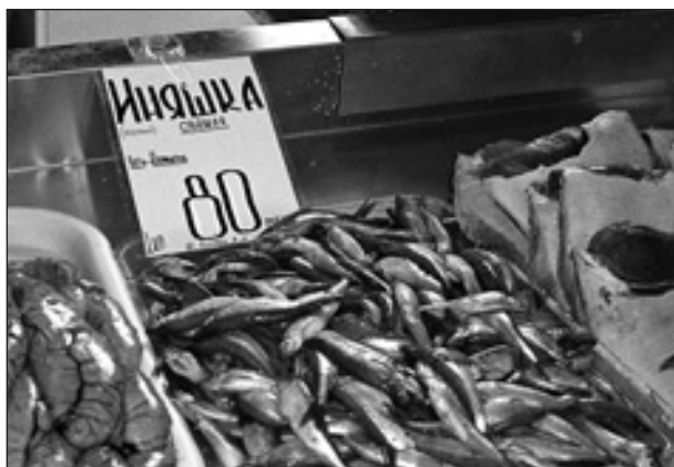
Рис. 1. Иняшка на прилавке городского рынка

Во второй половине апреля 2011 г. на прилавках городского рынка Петропавловска-Камчатского появилась необычная для торговой сети мелкая рыбка под названием «иняшка» (рис. 1). Она была привезена из Усть-Камчатска и поймана в р. Камчатке. По сообщению продавцов, в прошлом жителей Усть-Камчатска, местное население ловит эту рыбу в большом количестве и использует ее в пищу.