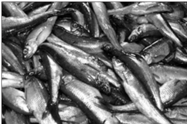
Рис. 2. Иняшка внешне напоминает кильку

Иняшка в продаже имела длину (стандартную) 81–113 см и индивидуальную массу 4–20 г. Несмотря на мелкие размеры, почти все рыбы были половозрелыми (рис. 3).