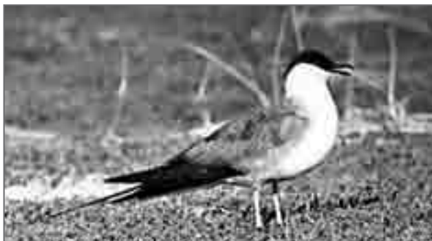
Длиннохвостый поморник – гроза крупных чаек и гагар

остров Карагинский и Камчатку, был назван так отнюдь не самим Фёдором Петровичем, а его благодарными соотечественниками.