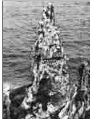
Одна из «высоток» восточного побережья