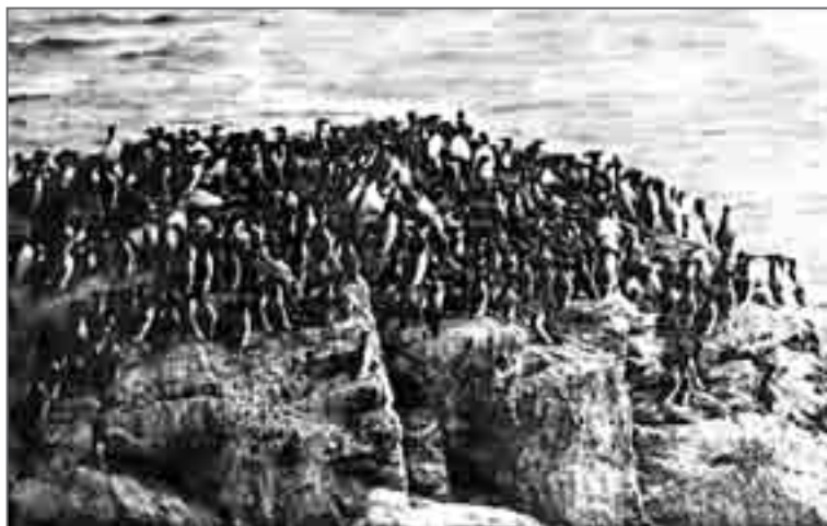
Юго-восточное побережье. Кайры плотно заселяют плоские участки скал

Весь длинный северный день мы фотографировали птиц на богатейшем птичьем базаре, том самом, что поразил меня в прошлом году.