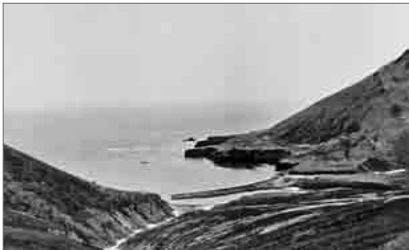
С перевала открывается вид на бухту Комаровскую

Устье реки Комаровской оказалось на удивление красивым местом, здесь же стоял небольшой уютный домик. Но отдыхать было некогда, я торопился увидеть самое большое на Карагинском острове поселение морских птиц и ещё сегодня вернуться домой к Николаю.