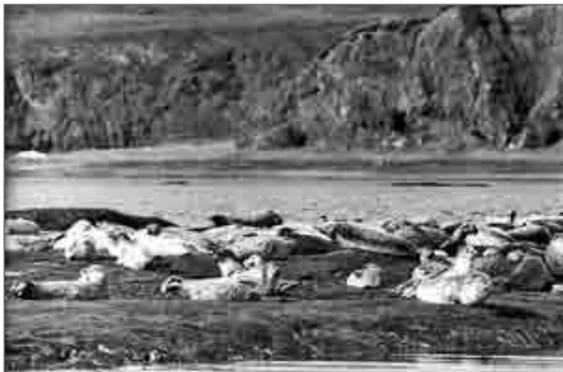
До нас ларги здесь были совсем непугаными

Всё-таки это был он – островной тюлень, антурус, имеющий также и необычное «народное» название – «тюлень-цветок». Так его называли за действительно очень красивую раскраску шкуры. Кто-то, глядя на неё, на очень тёмном поле видит белые венчики – «цветы», другие говорят, что это на белом поле густо-густо разбросаны тёмные фигурные пятна.