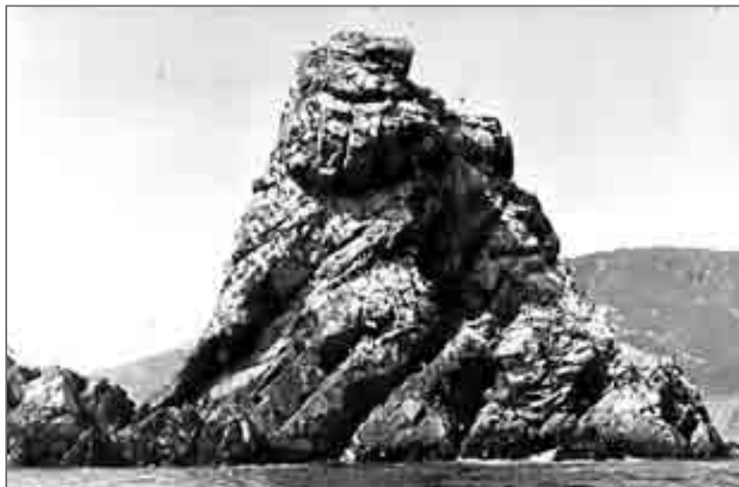
Одно из «общежитий» морских птиц

Утром 7 июля небо ясное, но дует неприятный порывистый восток. Запал он только за полдень. Я пошёл на имевшейся у нас лодке-«резинке» к ближайшим, «растущим» из моря, густо заселённым морскими птицами скалам.