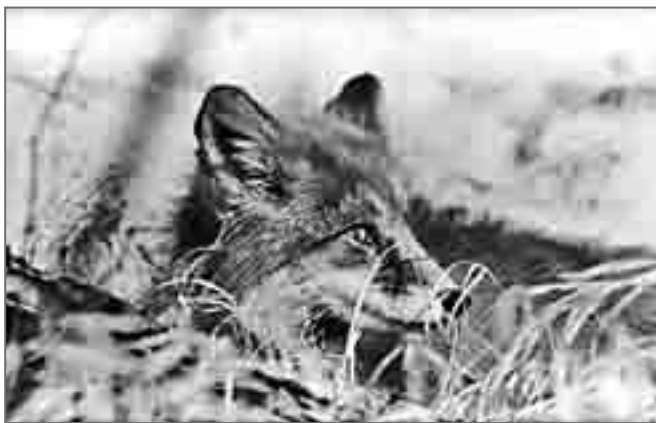
Молодая лисица еще не видела человека и ей хочется посмотреть, что это за зверь

Одним из главных персонажей фауны млекопитающих Карагинского острова несомненно является лисица ( Vulpes vulpes ). Почему? Сначала обратимся к одному историческому документу.