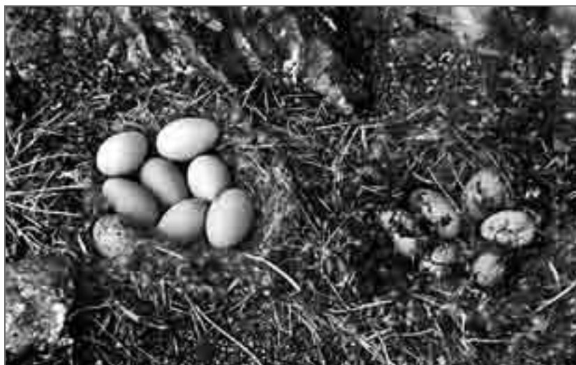
Так тесно живут на острове гаги и чайки, в гнезде гаги (слева) лежит яйцо чайки, в гнезде чайки шесть яиц. Сюрприз в том, что в гнезде чайки могут находиться только три яйца

еся по форме, оно резко выделялось своей рябой окраской. Однако гагу это, по-видимому, не смущало, и она добросовестно насиживала приёмыша. Недалеко в гнезде чайки с двумя собственными яйцами третьим лежало гагачье. Рядом обнаружилась также смешанная кладка, состоявшая всего из двух яиц. Какая из птиц считала её своей, для меня так и осталось загадкой.