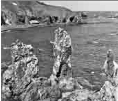
Восточное побережье острова изобилует причудливыми скалами

Тысячелетиями упорно трудилось море над восточным побережьем Карагинского острова. Слагающие его геологические породы сопротивлялись, но волны где с большим, где с меньшим успехом всё-таки изъедали береговые граниты. И сейчас этот участок побережья представляет собой чрезвычайно изломанную линию, которая более чем наглядно рассказывает о непримиримости двух достойных противников – разрушителей-волн и сложенного коренными породами берега.