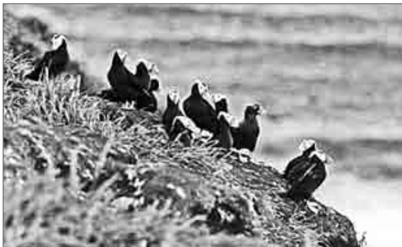
Топорки – «жители подземелий» Птичьего острова

Мне не однажды приходилось слышать рассказы о том, что топорок, сидящий на гнезде, спасаясь от человека, выкатывает ему своё яйцо. На Птичьем мы такого не увидели. Здесь нам пришлось наблюдать совсем другой, взволновавший нас, эпизод. Застав в неглубокой норе топорка, я решил его окольцевать. Птица против обыкновения не пыталась даже улететь. По-очереди заглянув в нору, мы видели, что топорок, лёжа грудью на яйце, упёрся клювом в землю и лишь как-то по-человечески горестно вздыхал. Я попытался снять птицу с яйца. Топорок ещё сильнее прижался к нему грудью и даже не пытался ущипнуть незащищённую руку, что в подобной ситуации не преминули бы сделать сотни других его сородичей. Мы оставили самоотверженную птицу в покое и поспешили уйти подальше от норы.