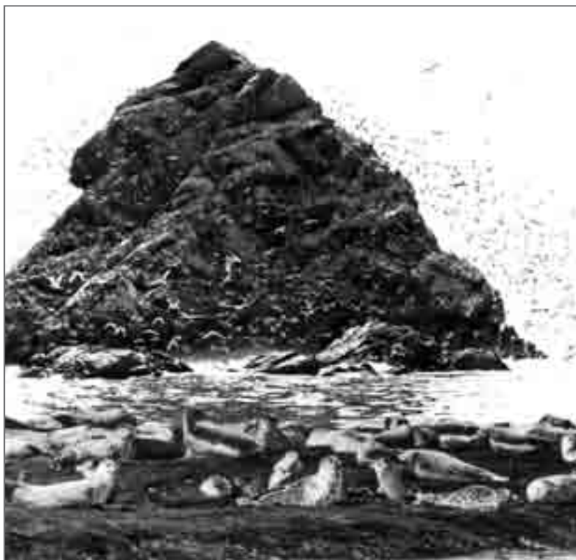
У подножий кекуров спокойно лежат ларги

Скальные обрывы здесь вертикально спадают в море с двадцати- и более метровой высоты. Прибрежье изобилует поднимающимися из моря скалами: острыми шпилями, причудливыми, похожими на останки древних замков, башнями. Иногда рядом с берегом стоят отделившиеся от него более массивные «куски», сохраняющие на себе остатки тундрового покрытия.