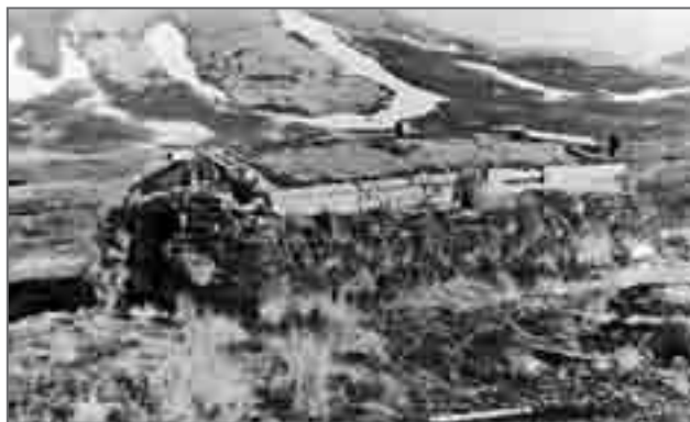
Землянка в бухте Северной. 1966–1972 гг.

жилье, знал я и то, что это скоро пройдет. Стоит только затопить печь, открыть дверь и окно и сделать самую необходимую приборку.