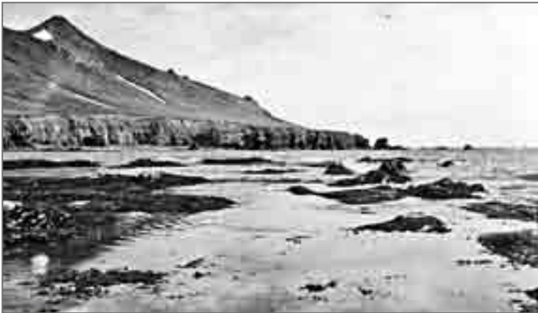
Фрагмент восточного побережья острова во время отлива

Во время моих островных экспедиций получение топографической карты или хотя бы близкого к действительному чертежа местности было сопряжено с весьма серьезными трудностями. В верхнем правом углу любого такого документа стоял гриф «Секретно». Допуска к секретным материалам я (по собственному, впрочем, желанию) не имел, и практически все первые экспедиции по острову совершались нами вслепую. Перед каждым очередным походом на лодке, если нам предстояло идти дальше, чем ранее, мы расспрашивали местных жителей о мысах, бухтах, реках, о каких-либо возможных опасностях на нашем пути. И чем дальше уходили мы по океанской стороне от мыса Голенищева на юг, тем больший дискомфорт рос у меня в душе. Проходя по неизвестному морю, утыканному скалами – кекурами, изобилующему скрытыми водой рифами, я с возрастающей тревогой вглядывался в проявляющиеся в тумане далёкие скалистые мысы. Что там за ними, есть там хотя бы небольшая бухточка или достаточно глубокое для нашей лодки устье реки на случай внезапного шторма? Очевидно, что я так и не смог вытравить из себя страх, испытанный в ту первую для нас встречу с жутким сулоем у мыса Голенищева.