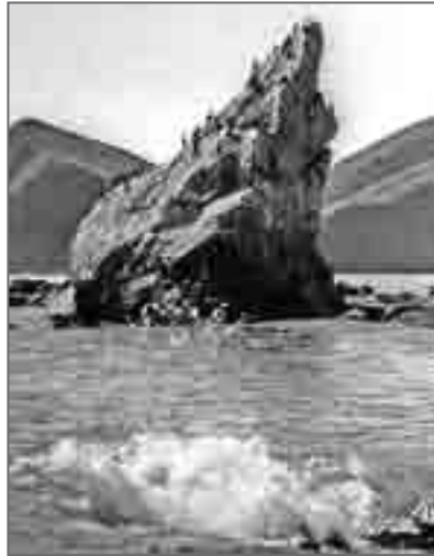
Летом 1970 г. скала, изображённая на этом снимке, рухнула в море

Много лет назад в одном из журналов я прочитал рекомендацию исследователя Заполярья по постройке снежного дома – иглу. Прошло совсем немного времени, и мы, четыре охотоведа, не знакомые ещё с жутью камчатских пург, на горном долу попали в многодневную снежную непогоду. Мы смогли построить иглу, и это действительно спасло наши жизни.