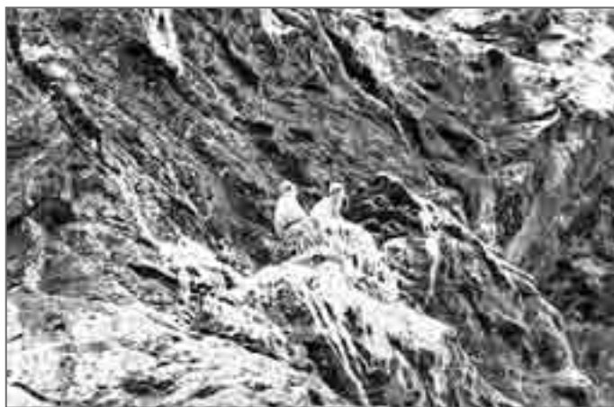
Глупыши на мысе Голенищева живут, занимая чужие гнезда