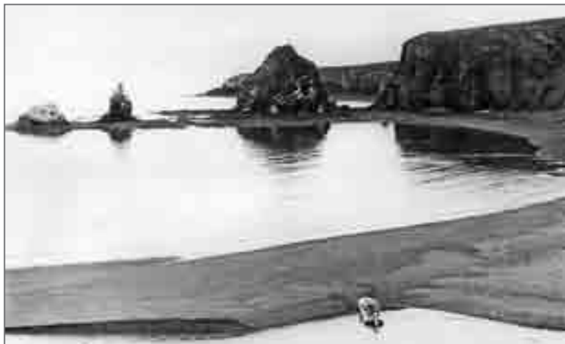
Побережье в устье Оскарынварам

Конечной точкой нашего конно-пешего маршрута оказалась река Оскарынварам. Мы не покрыли и четверти намеченного пути и здесь уже окончательно осознали всю несостоятельность поставленной нами цели этой экспедиции. За Оскарынварам морское побережье состояло из сплошных скальных обрывов, а приподнятое над ними плато то вдруг вырастало в высокие горы, а то резко обрывалось вниз ущельями речных долин. Пройти по кромке побережья острова с конём оказалось совершенно невозможным. А тут ещё на последнем переходе Чалый нечаянно оставил нас без значительной части взятых с собой продуктов. На участке с узким морским пляжем, когда нас подпирала приливная вода, конь поскользнулся, один мешок съехал ему под брюхо и оказался в морской воде. Большая часть наших съестных припасов пришла в негодность.