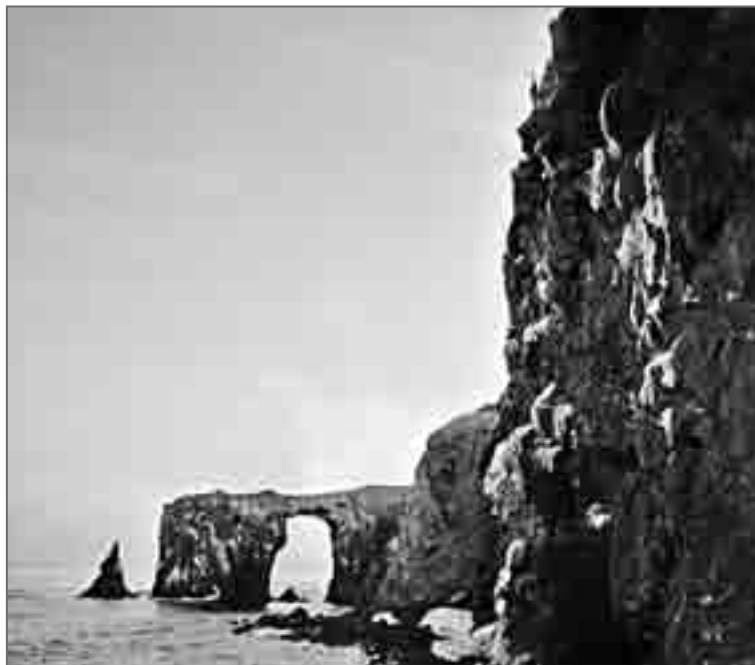
У этой арки заканчивается лента 5-километрового птичьего базара