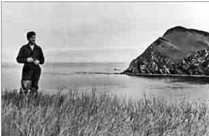
Бухта Северная. Мыс Горбатый. 1966 г.