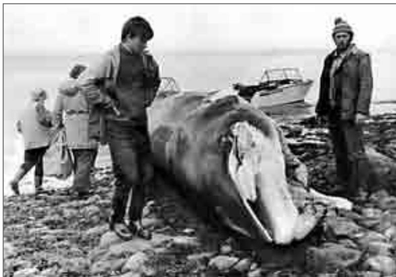
Раненый косатками молодой кит предпочел для себя другую смерть и выбросился на берег

рваная рана. Конечно же, это «работа» китов-убийц. Но почему, убив, косатки не воспользовались своей добычей? Учёные считают косаток разумными существами, и тогда вряд ли они стали бы убивать китёнка просто так, без пользы для себя.