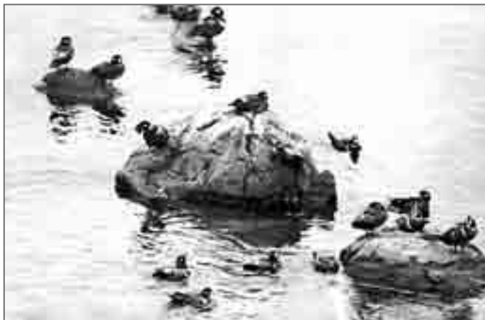
Бухта Северная. «Мужской клуб» каменушек

по устройству, снасть и поймал с десятков-полтора крупных королевских, впрочем, может быть – камчатских, крабов. Я же старался по возможности полнее использовать для своих научных сборов каждый день.