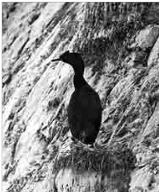
Вот она – «большая птица с маленькой головой»