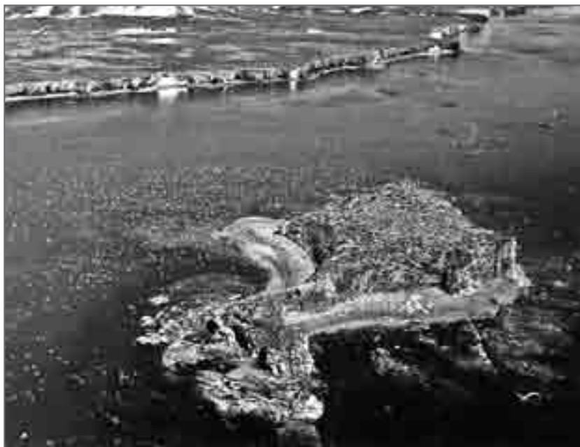
Так остров Птичий выглядит с вертолёта

Едва дождавшись прилива, далеко за полдень, наконец, вышли из устья Яклегрываям. И хотя не совсем удачно проскочили один из «баров», образующихся в устьях рек при столкновении двух встречных, речного и приливного, течений, и вода через ворот свитера добралась у меня аж до стелек моих сапог, я почти не обратил на это внимания. К нам стремительно приближался Птичий!