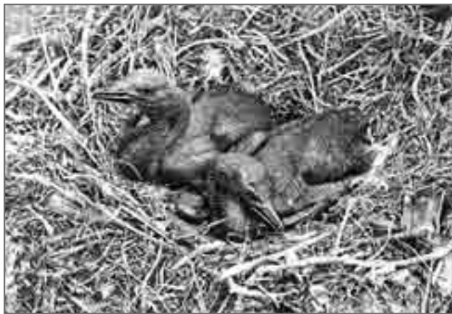
Юные бакланята. А может, это дети птеродактилей?..

Собрал пробы выстилки гнёзд тихоокеанских чаек и берингийских бакланов (это нужно для определения зараженности их паразитами), сделал промеры яиц, взвесил только что вылупившихся птенцов, на нескольких уже подросших чайчат и бакланят надел кольца.