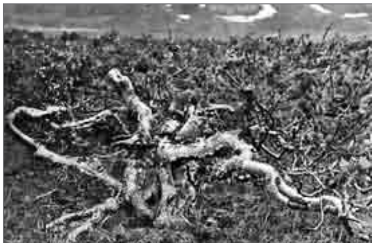
Береза на перевале из бухты Северной на побережье пролива Литке. Каким же кошмаром была вся ее жизнь!..