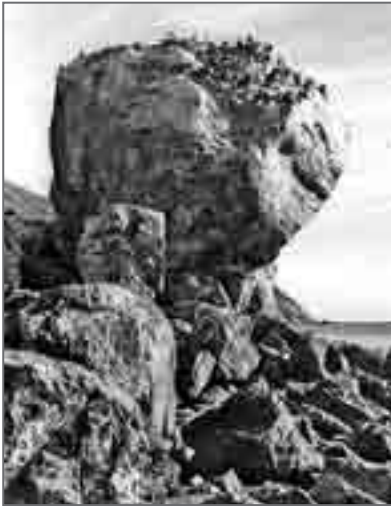
Эта скала – визитная карточка бухты Северной

ном, но, надо сказать, обыденном для полевых исследователей инциденте. И сейчас не стал бы об этом вспоминать, не случись здесь же по прошествии довольно многих лет несчастья – гибели студента-биолога. Он, очевидно, шёл близко к краю обрыва или замешкался на «ожившем» под ним щебне. А рассказываю я об этом лишь с одной целью: хочу предостеречь молодых неопытных полевых исследователей, путешественников, туристов от смертельной опасности – текущих щебневых рек.