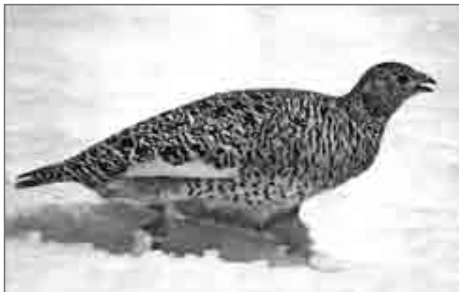
Тундряная куропатка отводит от птенцов

Неожиданно для меня откуда-то сверху, с гор прилетел и упал рядом с самкой на снег второй родитель – куропадч. И у отца тотчас «сломались» оба крыла – он предлагал в жертву себя. Я поторопился сделать ещё несколько снимков всех членов этой семьи и, прогнав, чтобы не простудились, малышей со снега в траву, поспешил уйти.