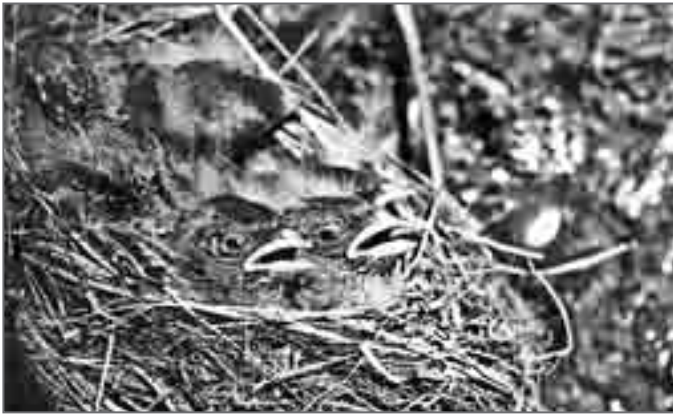
Гнездо загадочной птицы – сибирского горного вьюрка. 1969 г.

подсчитать, сколько же гнёзд с птенцами можно здесь услышать с одного места. И в это время одна птица, подлетевшая по распадку откуда-то снизу, села на противоположный, более пологий склон ущелья. Она нырнула под каменный козырёк за кустик волжанки ( Ranunculus ), и оттуда раздался дружный писк птенцов. Семь метров не очень крутого склона я преодолел легко. Гнездо не пришлось разыскивать, оно располагалось на краю маленькой пещерки. Я сфотографировал его, описал и тоже запечатлел на плёнку птенцов, зафиксировал разрывы во времени между приносом родителями корма. Понимаю, что для многих людей это не явилось бы событием, но я в этот момент был счастлив: в нашей науке орнитологии заштриховано ещё одно маленькое «белое пятнышко».