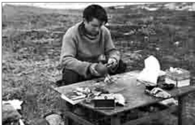
Бухта Северная: я работаю с собранными материалами, 1966 г.

Находясь в поле, я нередко ощущаю сильную потребность в уединении. Тогда я беру дневник, а иногда, когда это случается ночью, еще и фонарик, и, где-нибудь в удалении нахожу для себя спокойное место. Вслед за этим иногда наступает совершенно удивительное состояние, когда кажется, что я буквально растворяюсь в окружающей природе, сливаюсь с ней, и тогда для её восприятия у меня раскрывается сердце. В такие минуты, как бы пребывая вне своей телесной оболочки, я совершенно по-особому воспринимаю окружающий меня мир природы. Тогда, весь раскрытый настежь, я лихорадочно, до предела сокращая слова, пишу и пишу все, что вижу, что чувствую сейчас. К сожалению, минуты такого состояния бывают очень скоротечными. И, если именно это называется вдохновением, остается только сожалеть о малой толике отпущенного на мою долю столь удивительного состояния. Я всегда жду таких мгновений. Именно в эти минуты сделаны самые интересные, самые сокровенные записи в моих дневниках. Но их всего лишь микроскопические крупички среди обыденных нужных рабочих дневниковых материалов.