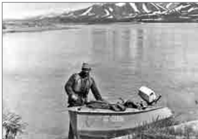
На лимане реки Маркеловской

На двадцать километров хода по спокойной воде между устьями Плоксана и Маркеловской нам хватило часа с небольшим. Пройдя между крутым и довольно высоким здесь берегом и песчаной косой, наша «Казанка» оказалась в спокойном и красивом лимане. Прекрасная погода, широкая долина реки была буквально переполнена радующими меня весенними голосами самцов шилохвостей ( Anas acuta ), свиязей ( A. penelope ), чирков-свистунков ( A. crecca ), пронзительными вскриками чаек, истошными – краснозобых гагар ( Gavia stellata ) и «жеребьячим ржанием» серощёких поганок ( Podiceps griseigena ).