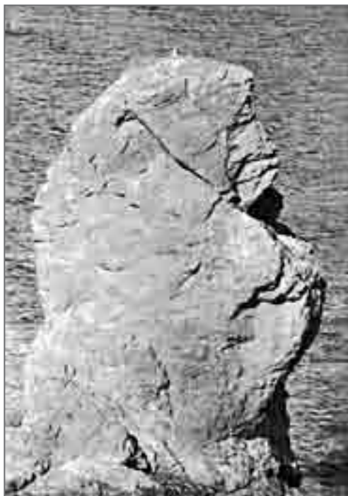
В этом каменом изваянии коряки видят бабку

но действительно очень могучий исполин. Сделанные мной снимки были опубликованы в «Камчатской правде». И тогда кто-то увидел в его лице явно выраженные черты гордого, невозмутимого индейца, другие говорили, что это старик-рыбак, сурово смотрящий на штормовой океан. Но все сходились в одном, все говорили, что это изваяние «старого» человека. Как оказалось, его прекрасно знали местные оленеводы. Мало того, сказали они, мы ещё прошли мимо каменной скульптуры женщины с ребёнком. Честно говоря, мне трудно представить, чтобы здесь же природой было создано ещё одно такое удивительное творение.