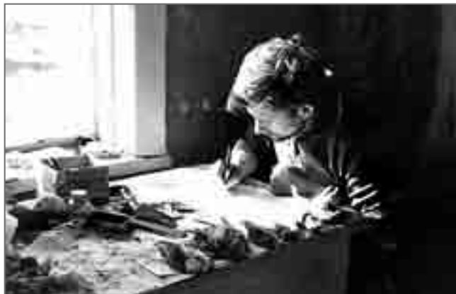
Домик Марковых. Обработка собранных материалов. 1966 г.

В экспедициях на Карагинский остров мне пришлось добывать поморников, тушки их сейчас находятся в научных коллекциях МГУ. К сожалению, при таких работах отстрел какого-то числа птиц бывает необходим. Рассказ о «разбойных наклонностях» поморников отнюдь не говорит о каком-то отрицательном моём отношении к ним. Это действительно красивейшие, совершеннейшие создания нашей Природы. Добыча даже очень интересного с научной точки зрения экземпляра какого-то вида мне почти всегда приносит больше сожаления, чем радости от удачи. Описанные же здесь редкие из моей полевой практики случаи заставляют задуматься над истинностью некоторых научных догм, забитых в наши головы в институтах. А незабываемые воспоминания об этих трёх эпизодах постепенно стали отвращать меня от ружейной охоты.