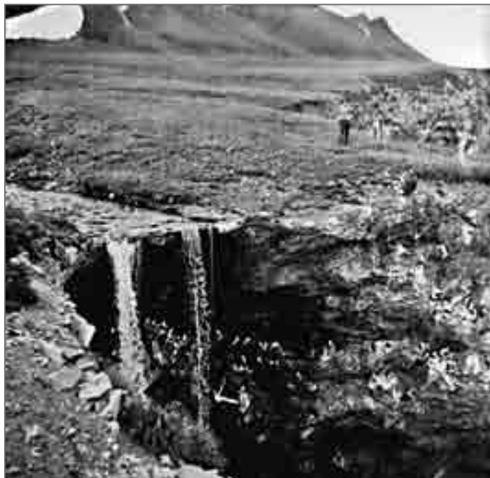
Фрагмент скального участка гнездования птиц

Вернулись к ужину. Плавник, как нам сказал Николай, весь день то появлялся, то вновь исчезал, и всё на одном и том же месте.