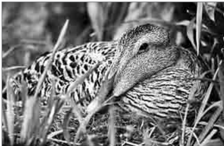
Смелая гага спокойно взирала на нас с гнезда, сделанного в скальной нише