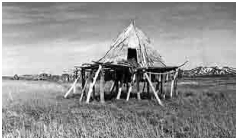
Юкольник – типичное северное «строение»