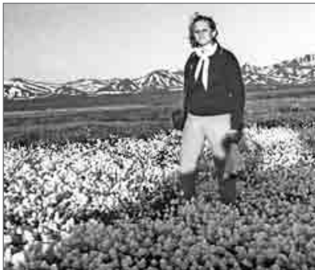
На тундровой пушицевой лужайке стояла юная фея

И вдруг я действительно услышал пение! Да какое! Недалеко от меня на тундре пела невидимая мне девушка. Голос её казался сказочно красивым, наверное, именно так пели сирены, заманивая Одиссея в море. По спине побежали мурашки: такого здесь просто не могло быть! Не зная, что сейчас увижу, я потихоньку вылез по склону увала на тундровое плато. В полутора-двух десятках метров от меня на тундровой пушицевой лужайке пела юная фея – девушка. Но этого не могло быть: к моим слуховым галлюцинациям добавились ещё и зрительные! В общем-то плохо что понимая, я, тем не менее, взялся за свой «Зенит» и сделал несколько снимков. Где-то там, в сознании шевелилась мысль: «Интересно, останется ли что на плёнке?» А по спине продолжали бегать холодные мурашки.