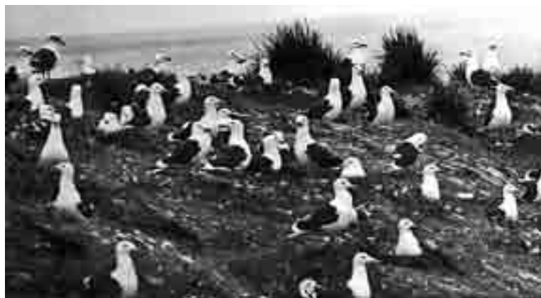
Первыми с нашим присутствием смирились тихоокеанские чайки