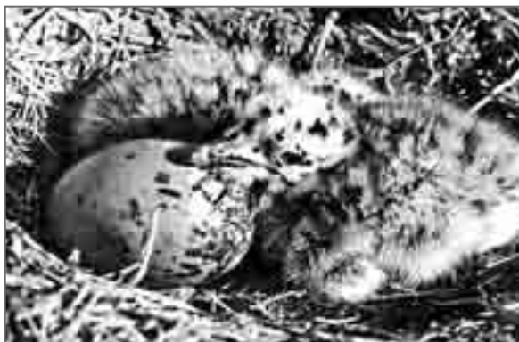
Ждут появления третьего

Они первыми смирились с нашим вторжением. Взрослых тихоокеанских чаек здесь не менее двух с половиной тысяч, и все как одна в накрахмаленных белоснежных сорочках и тёмных фраках. Ни одной серой неполовозрелой особи в этой колонии мы не обнаружили. Уже опустившись недалеко на землю, птицы ещё что-то выкрикивают в наш адрес, но потом житейские дела берут верх, и супружеские чайачьи пары начинают ревниво осматривать свои, судя по всему, очень мизерные, владения. В колонии тихоокеанских чаек птицы постоянно живут в состоянии «военного перемирия». Стоящая у своего гнезда и с презрительной гордостью поглядывающая по сторонам чайка – это самая яркая поборница частной собственности. На гнездовой участок допускается только второй член семьи. Стоит одному из соседей при посадке промахнуться на сантиметр-два и чуть заступить за только им, соседям, известную запретную черту, куда исчезает величавость хозяина попранной территории. Он сразу же бросается бить мнимого захватчика, при этом, увлечшись, почти обязательно переступает границу, и тотчас сам бывает бит. Как птицы различают границы своих гнездовых участков, для меня так и осталось загадкой. Ясно одно, что в гнездовой колонии чаек существует строгий порядок, и правила общежития здесь должны соблюдаться неукоснительно.