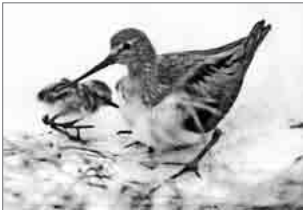
Мородунка с малышом. 1966 г.

Ягодное подарило мне ещё одно приятное орнитологическое открытие. Когда в гостеприимном селе все наши дела на сегодня были закончены и мы шли к своей лодке, чуть ли не из-под самых наших ног выбежала сильно встревоженная мородунка ( Xenus cinereus ). Этот симпатичный куличок, насколько я знал из литературы, должен был гнездиться далеко к северу от здешних широт. Но птица была явно с детишками, и они, скорее всего, где-то здесь, совсем рядом. Пока мы, боясь сделать неосторожный шаг, внимательно всматривались в траву, у одного не далее как вчера родившегося малыша не выдержали нервы, и он бегом бросился искать более надёжное, на его взгляд, место укрытия. Я, конечно же, не мог позволить ему скрыться, и отважная мать с тревожным тонким свистом бросилась к самым моим ногам. Быстро надев на маленького куличка колечко, я буквально «с рук на руки» передал его матери, и она, будто нас здесь и не было, сразу же присела, забрав кроху под себя.