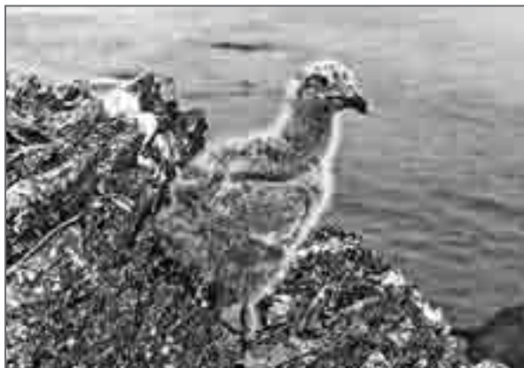
Птенец чайки высокомерно смотрит на пришельцев

Меня поражает вдумчиво-высокомерный вид птенцов тихоокеанской чайки, которым всего-то три-пять дней от роду. Эта, можно сказать, врождённая царственность осанки, поневоле вызывающая уважение. И, тем не менее, невзирая на пронзительный крик родителей, мы теперь уже втроём ловим благородных отпрысков, надеваем им на ноги металлические кольца и, поздравляя с приобщением к науке, отпускаем.