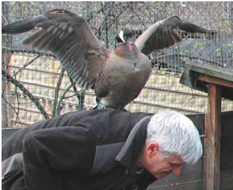
В нападении он старается подобраться ближе к голове

Отдельные особи оставались столь же неуёмными в своей «ненависти» и с появлением гусят. И тогда мы прибегали к радикальной мере — изымали их из семьи. В свой вольер он возвращался через пять-семь дней и, как правило, становился уже более «покладистым».