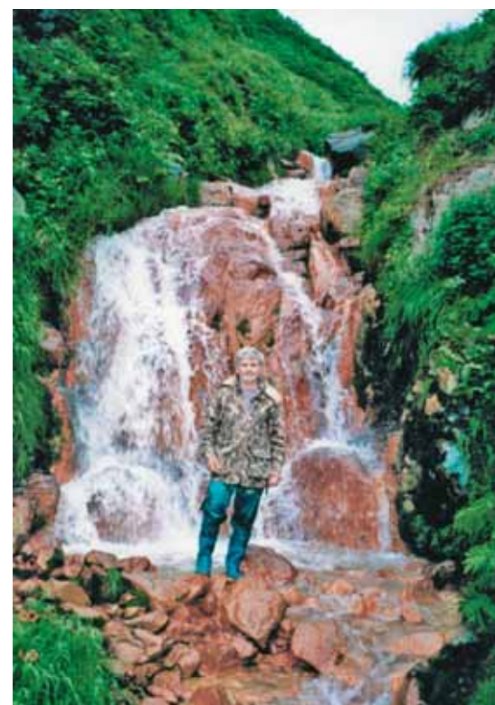
И таких водотоков на Экарме немало

Вздыбленный рельеф острова Экарма уже по своему строению предполагает наличие глубоких распадков. По ним вопреки сообщениям Сноу в море стекает, очевидно, не менее десятка немногочисленных, но не иссякающих в течение лета небольших