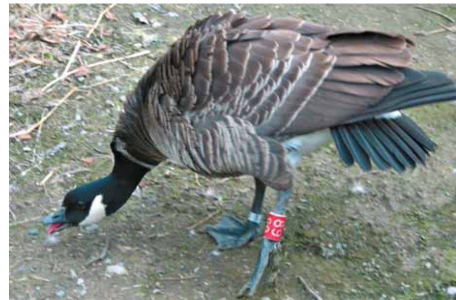
Самец в позе предупреждения о последующем за ним нападении

получить несколько больных щипков и ударов, мы бегом (это ещё больше вдохновляет драчуна) покидаем вольер. В общем-то, это нужно считать «нормой», и тем более удивительными для нас поначалу были случаи резкого изменения поведения некоторых таких боевитых отцов сразу же с