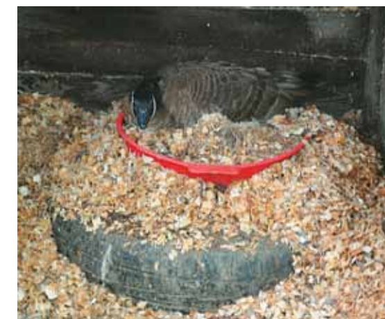
Гнёзда с кладками помещались в тазы

Из большинства яиц уже слышались голоса гусят. И казарки, наверное, не меньше, чем мы, не хотели их гибели. Все птицы, едва мы выходили из вольера, тотчас занимали до неузнаваемости трансформированные гнёзда. А потом, по прошествии дней, некоторые птицы ещё долго не теряли надежды согреть уже погибшие кладки.