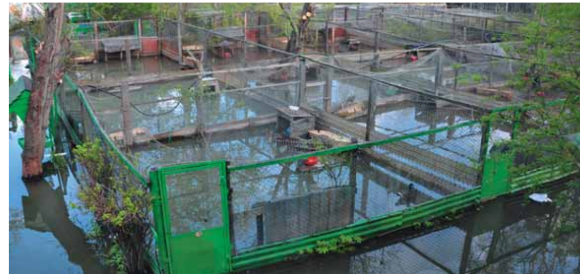
Под водой оказалась и вся «воспроизводственная» территория

Вода между тем продолжала подниматься с удивляющей скоростью: когда мы «обустроили» гнездо в пятом по счёту вольере, в первом кладка уже покрылась водой.