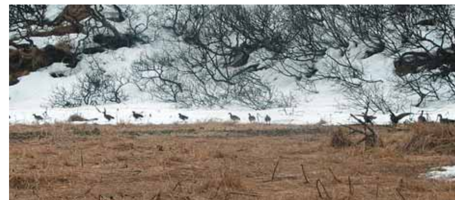
Птицы тогда уходили от нас пешком