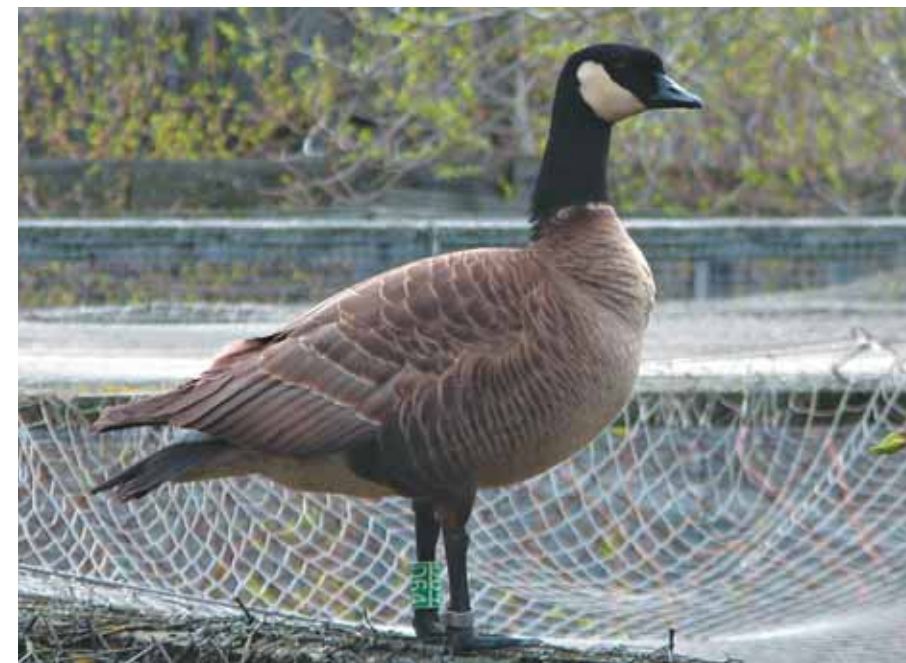
«Залётная» казарка несколько дней ходила по верхам вольеров

Гусь между тем облюбовал для себя верха вольеров, сквозь сетку рассматривал находящихся внизу птиц. Потом перелетал на озёрную часть питомника, где к нему тотчас устремлялся один из наших «холостяков». Этот «один» права на прилётную гостью (очевидно, это была именно дама) заявил уже с первого своего с ней знакомства. В её отсутствие наши самцы держались вместе, но стоило рядом по-