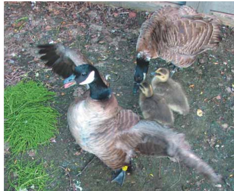
«Не отдам!» — так каждый раз встречает наше появление в вольере самка 82

Все вольеры уже через два-три года после заселения в них птиц полностью лишались любой годной для питания казарок травянистой растительности. Однажды во вновь построенном вольере мы обратили внимание на подрастающий сплошным ковром травостой. Самка насиживала кладку, самец находился рядом. К траве самец не касался, она, для нас это было ясно, для корма была непригодна. Вывелись казарчата, и через несколько дней травяной покров был выведен ими полностью. Оказывается, корм сохранялся для будущих малышей. И это стало ещё одним штрихом к нашему пониманию роли самца в семействе