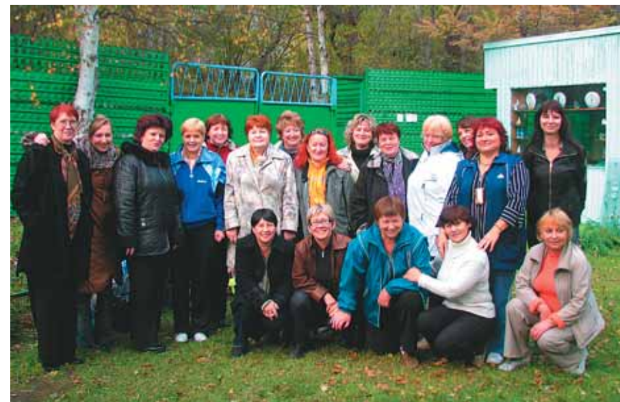
Учителя школ Камчатки

— Нет. У нас не зоопарк, а питомник для разведения редких диких гусей.