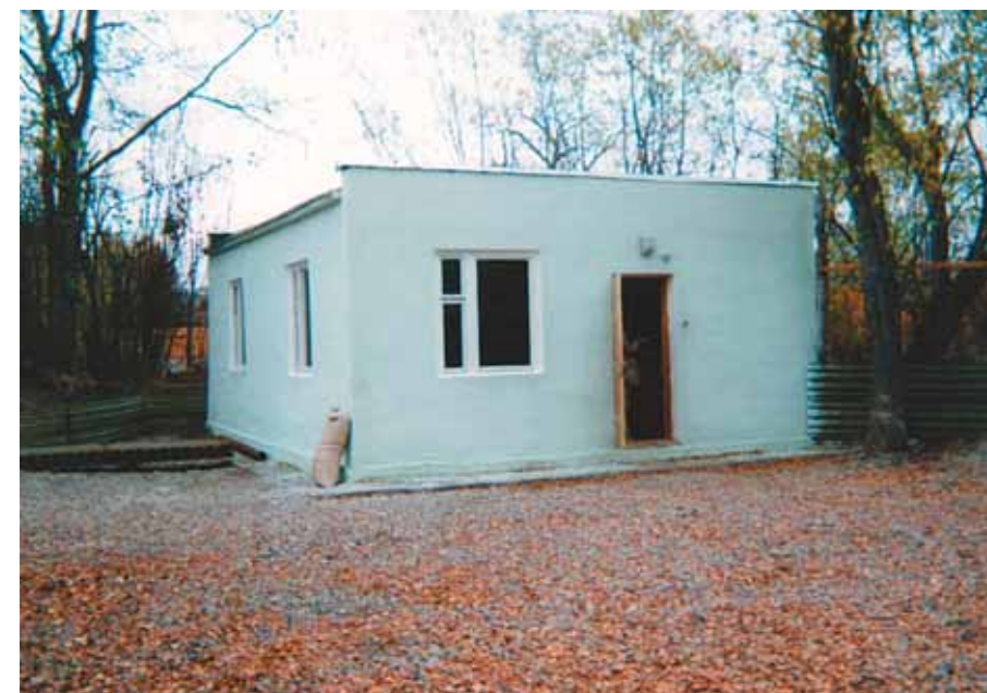
Казарок ожидало зимовочное помещение (конец сентября 1992 года)

А вот нам, неприкаянным, жить оказалось негде. Изобразив из клеток, в которых к нам привезли птиц, подобие ложа,