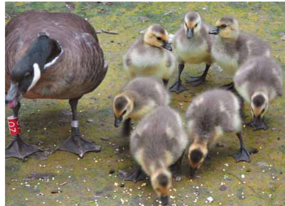
Они растут и постоянно хотят есть

«Сегодня 19 июня 1996 года. Четырём малышам только-только исполнилось пять дней отроду, а они уже третий день не вылезают из воды. Летнее половодье подтопило нашу территорию, вода проступила во всех вольерах. Нам беспокойство, а маленьким казарчатам это, похоже, в большую радость. Они плавают, что-то активно выискивают в сырой земле; к счастью, добывшему вдруг земляного червя, тотчас устремляются один или два родственника и устраивают с ним «кучу-малу». Гусята этого выводка по сравнению с малышами из всех других семей на удивление самостоятельны. Уже не первый день пуховички не держатся своих родителей, а каждый занимается сам по себе, чем хо-