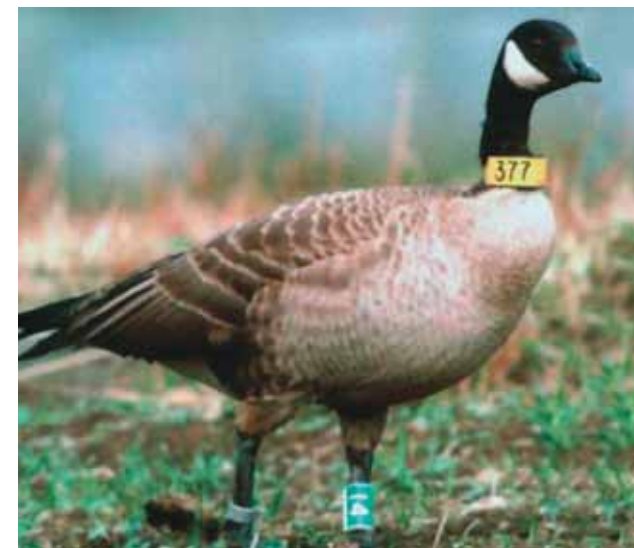
Одна из первых наших казарок в Японии

Сейчас же на фото мы видим одну из самых первых наших казарок, оставшихся зимовать на острове Хоккайдо. Прилетела ли она туда вместе с лебедями или присоединилась к ним только в Японии, не известно. И здесь семья из двух взрослых и шести молодых кликунов явно приняла, «усыновила» нашу казарочку на трудное для неё время зимовки. Коллеги сообщали, что другие лебеди, пытавшиеся как-то обидеть, прогнать сидзюкара-ган, тотчас семьёй изгонялись сами. Такой вот удивительный феномен проявления межвидового альтруизма.