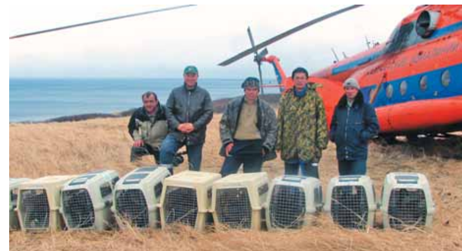
Единственный весенний выпуск, Экарма, май 2006 года