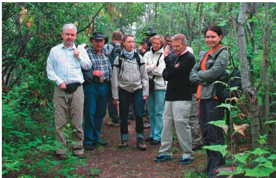
На озёрной части нашей территории любители птиц из Дании

Уже потом о питомнике узнали учителя городских школ, воспитатели детсадов и интернатов.