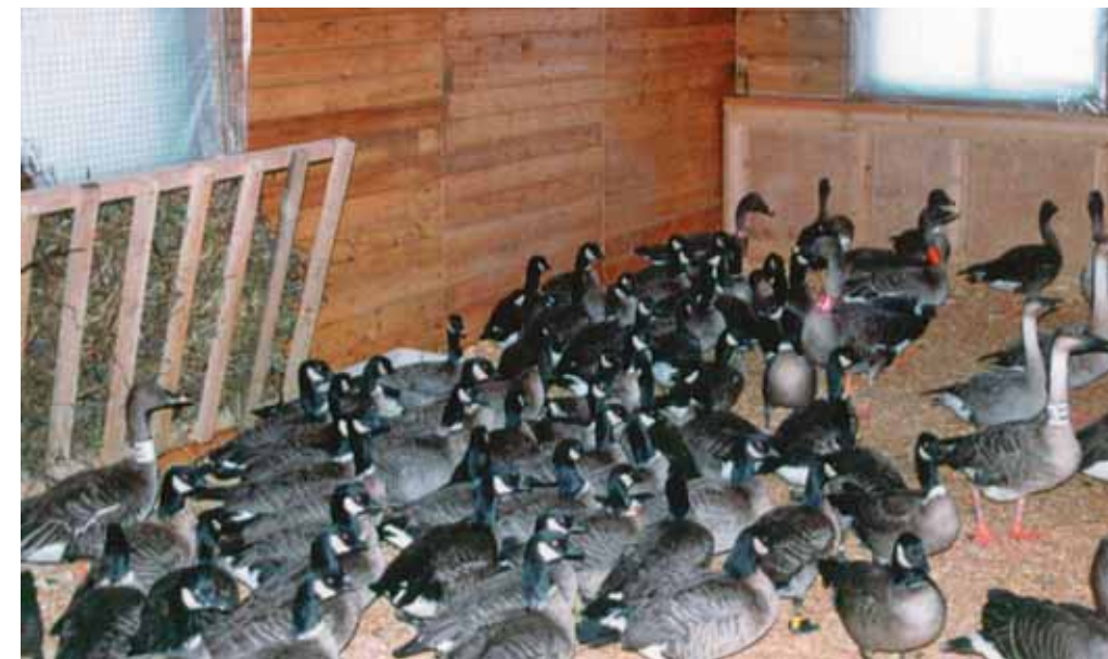
С ноября гуси ночуют, а в морозные дни и днюют в зимнике

С выпадением снега с территории питомника исчезают домовые воробьи, безраздельно пользующиеся ею летом. Остаются воробьи полевые. Раньше я как-то не обращал на это внимания. Так же случилось и в ноябре 2006 года. Зима в этот раз у нас выдалась на удивление «безптичья»: ни снегирей с осени, ни чечёток, ни синиц-гаичек. И только в конце декабря у нашего крыльца появились сначала два, потом стали прилетать три, а затем кормились уже шесть полевых воробьёв. Они были чу-