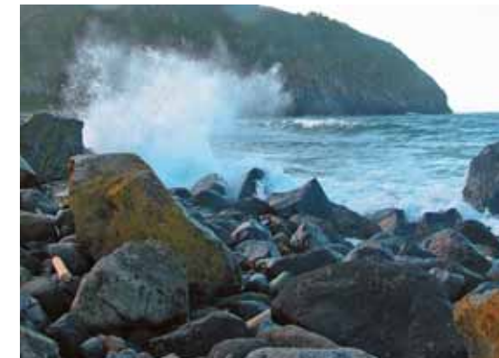
Характерный участок северного «пляжа»

Однако южная, самая непривлекательная для нас его часть была открытой. Вертолёт завис, мы попрыгали в высокую, казавшуюся сухой травянистую растительность, а пилоты ещё несколько минут пытались подыскать в ней подходящую для посадки Ми-8 площадку.