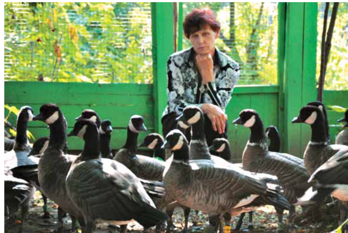
Не полюбить этих птиц невозможно

Ребята начинали свой проект без меня, и их самих для этого поначалу было достаточно. Они вели начальные строительные работы, и женский глаз в первые два и даже три года здесь вряд ли был бы так обя-