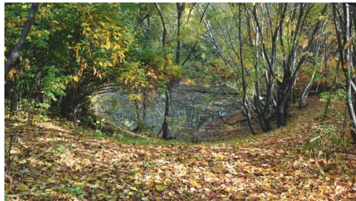
В питомнике вторая декада сентября

Нам жалко расставаться с летним теплом и так хочется считать, что хотя бы первая половина сентября — пора ещё летняя. Но с этим почему-то никак не хочет согласиться максималистка черёмуха. Ещё совсем тепло, а она торопливо избавляется от своих, уже поблекших листьев. Через не-