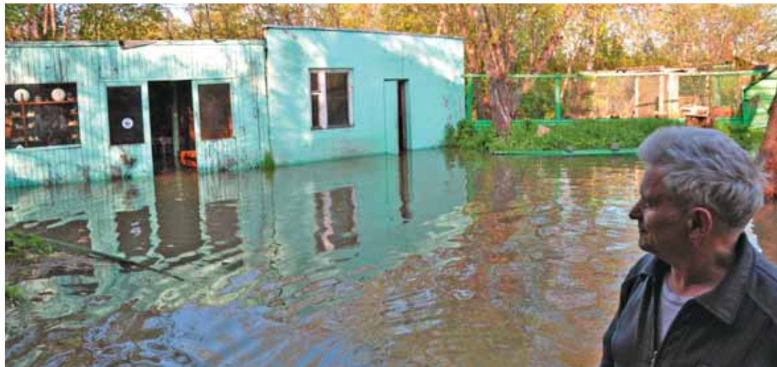
Такой «прихожую» питомника увидел объектив Е. Сыроечковского 4 июня 2009 г.

казарчёлка грелись, тесно прижимаясь к бокам вчера ещё такого недружелюбного «старшего брата», пятый лежал на его спине. Так у маленьких «подкидышей» появился, как потом выяснилось, очень ревностный «приемный родитель».