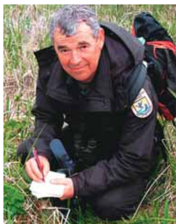
Вернон Бёрд, о-в Булдир