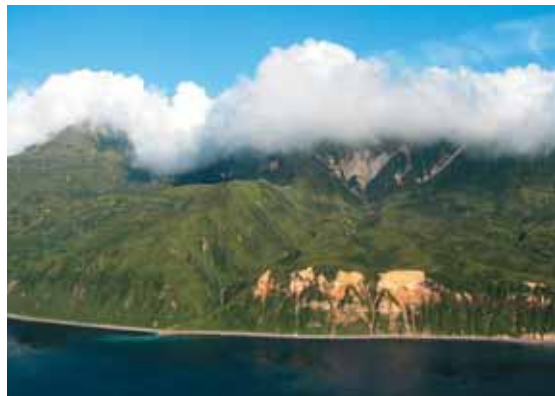
Береговая линия острова Экарма, в основном, представлена крутыми обрывами