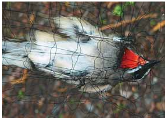
Впервые этот красношейка побывал в наших сетях шесть лет назад

Голоса летящих над Авачей на юг перевозчиков и крачек — Sterna hirundo ещё