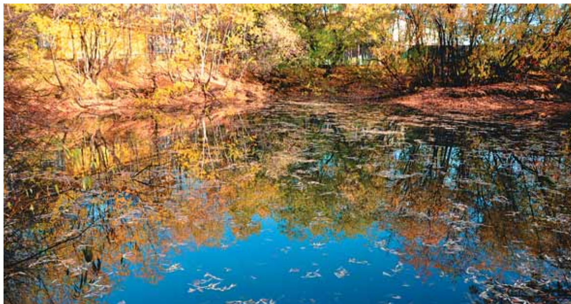
Наш водоём в первой декаде октября

Утренние температуры на дворе потихоньку подползают к минусам. А всего