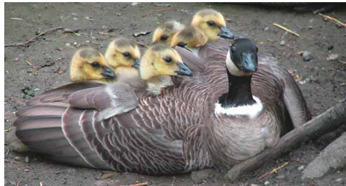
Казарки — очень заботливые родители

У мелких птиц период больших забот и нескончаемых. Им сейчас не до песен: надо кормить родившихся ещё в прошлом месяце, но ещё требующих внимания постоянно голодных детей, к тому же птицы боятся привлечь к ним врагов. Но, оказывается, в это лето они замолкли ещё не совсем. И вот уже вновь без купюр исполняет свою арию соловей-красношейка, ему вторят малые мухоловки, овсянки, нет-нет да опять во весь голос заявит о се-