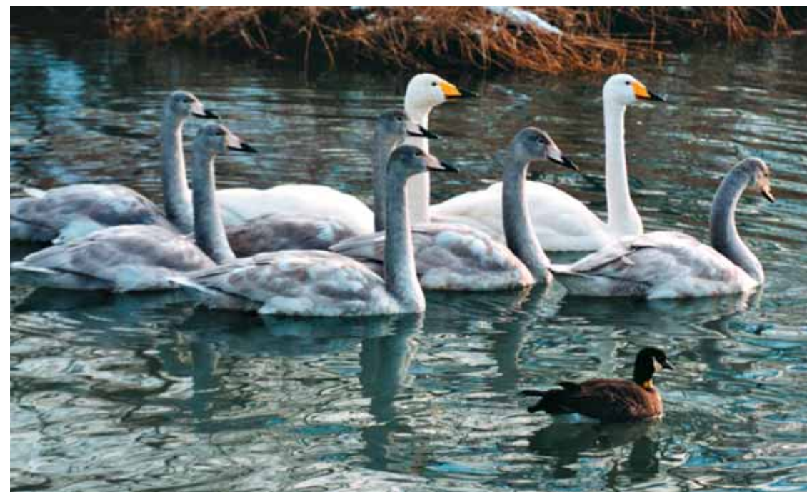
Семья кликунов, принявшая в свою стаю алеутскую казарку

Основным критерием, определяющим успешность наших усилий, является рост числа птиц на исторических японских зимовках. Выпуски казарок продолжались: 28, 16, 12 птиц были завезены на Экарму в последующие годы. Закончились они едва