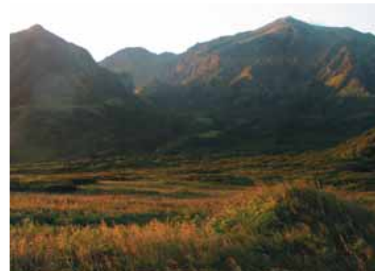
Место всех последних выпусков птиц