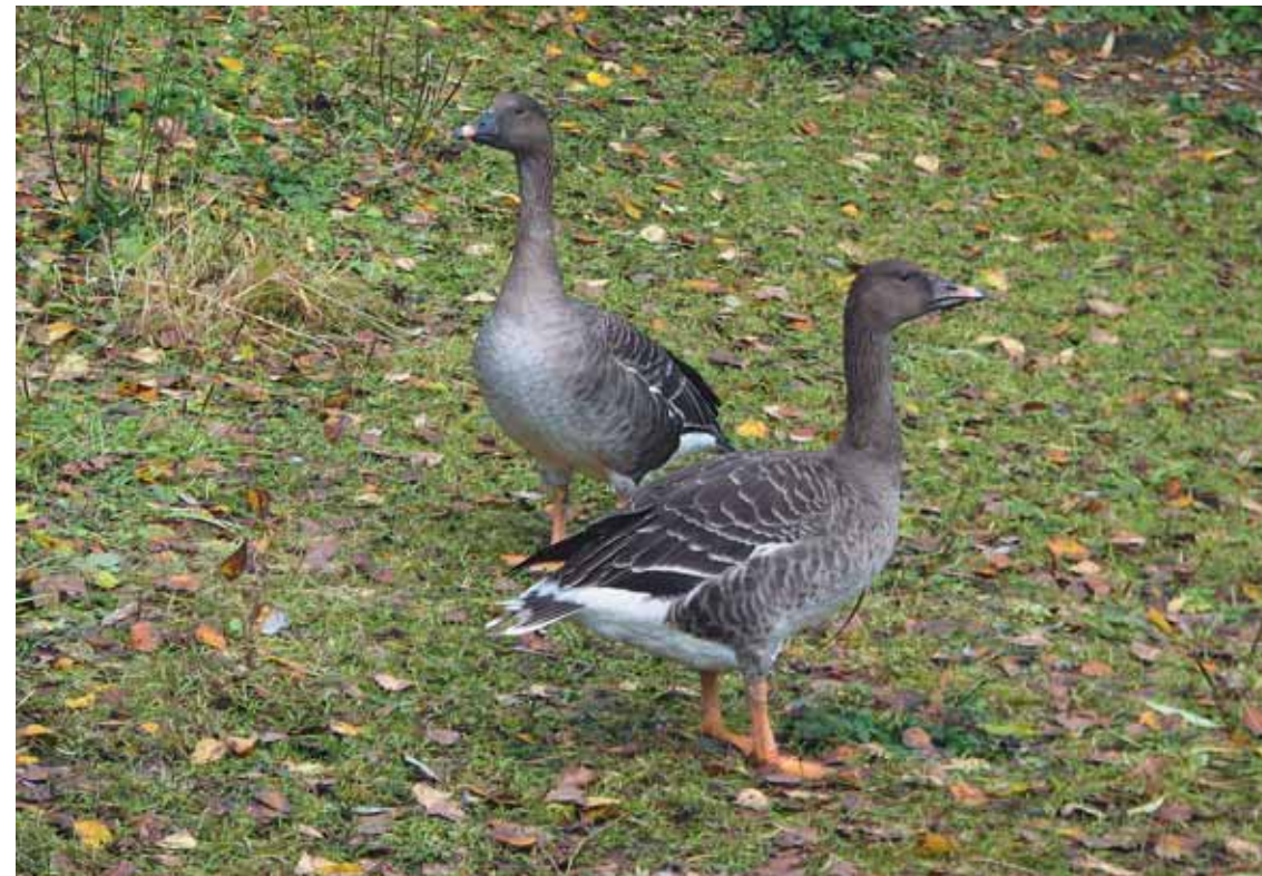
Тундровые гуменники Западной Камчатки