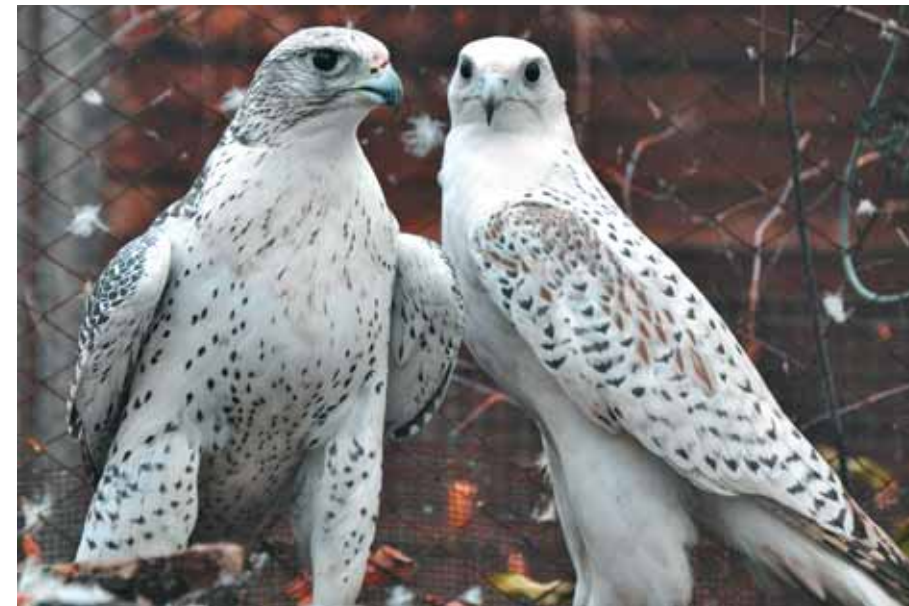
Наши «невольные невольники» — кречеты

Здесь, очевидно, нам пора рассказать о том, что, кроме гусей, в нашем питомнике