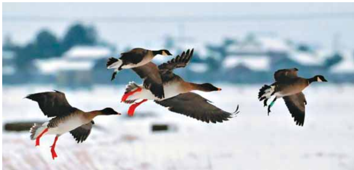
Наши «возвращенцы» и в Японии держались вместе

ленного нам его автором Teruo Tazawa. Вот они — D 68 и D 64 летят вместе с двумя гуменниками Миддендорфа над заснеженными полями острова Хоккайдо.