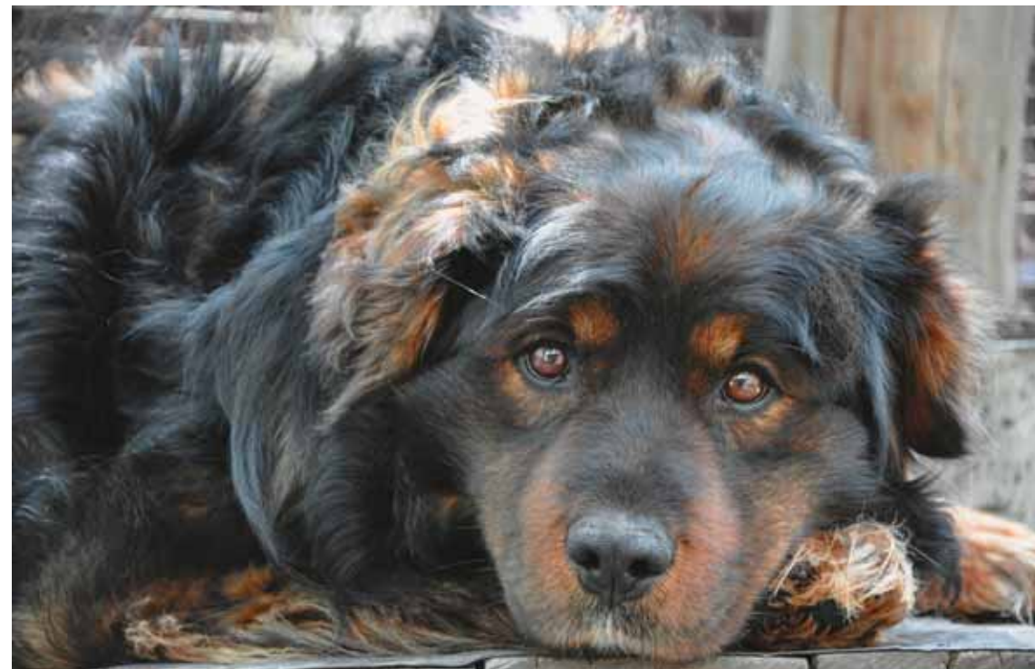
Наш верный охранник Гром

Этот год был в череде тех, когда бессонница и нелёгкие думы мучили меня особенно часто. Какого понимания наших задач, наших трудностей можно ожидать от некоторых зажавшихся чиновников Камчатки, если «Скажите, а кому всё это надо?» задаёт будущая (это не оставляло сомнений уже ни у кого) «первая леди» России.