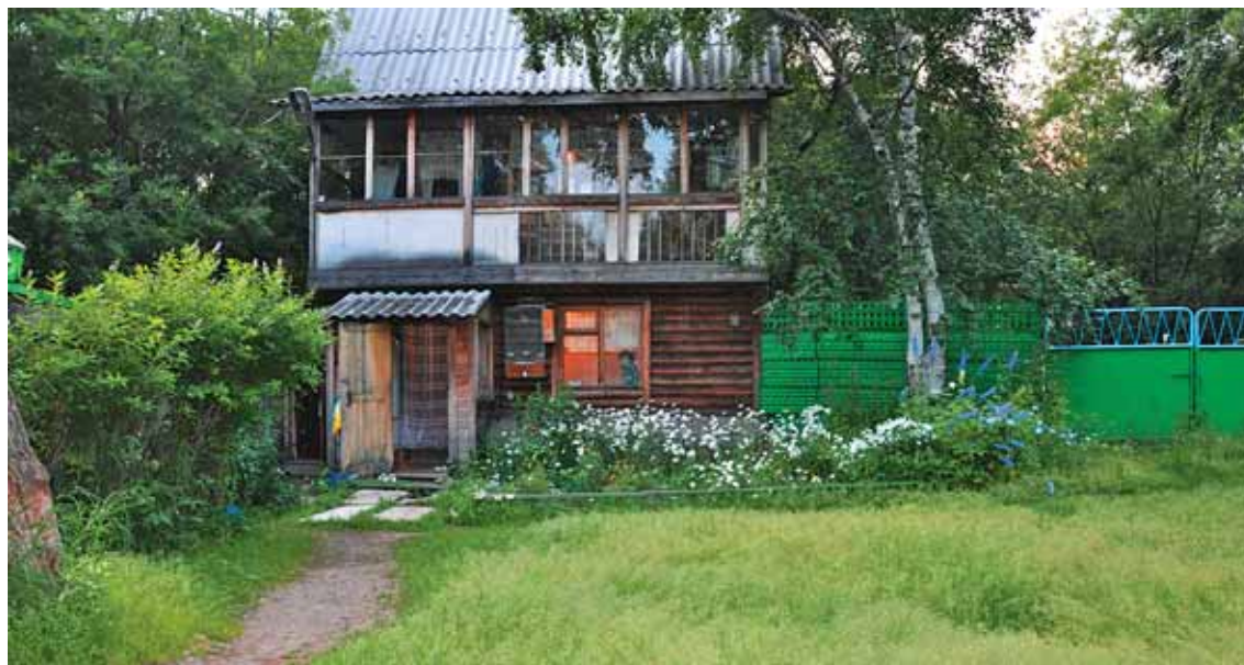
Наш дом годы спустя

несколько ночей я провёл вместе с гусями в зимнике. Оказалось, что для такого соседства нужно иметь действительно крепкое сердце. Минимум четыре-пять раз за ночь тишина вдруг взрывалась дружным, спросонья кажущимся диким рёвом криком всех девятнадцати горластых «птичек».