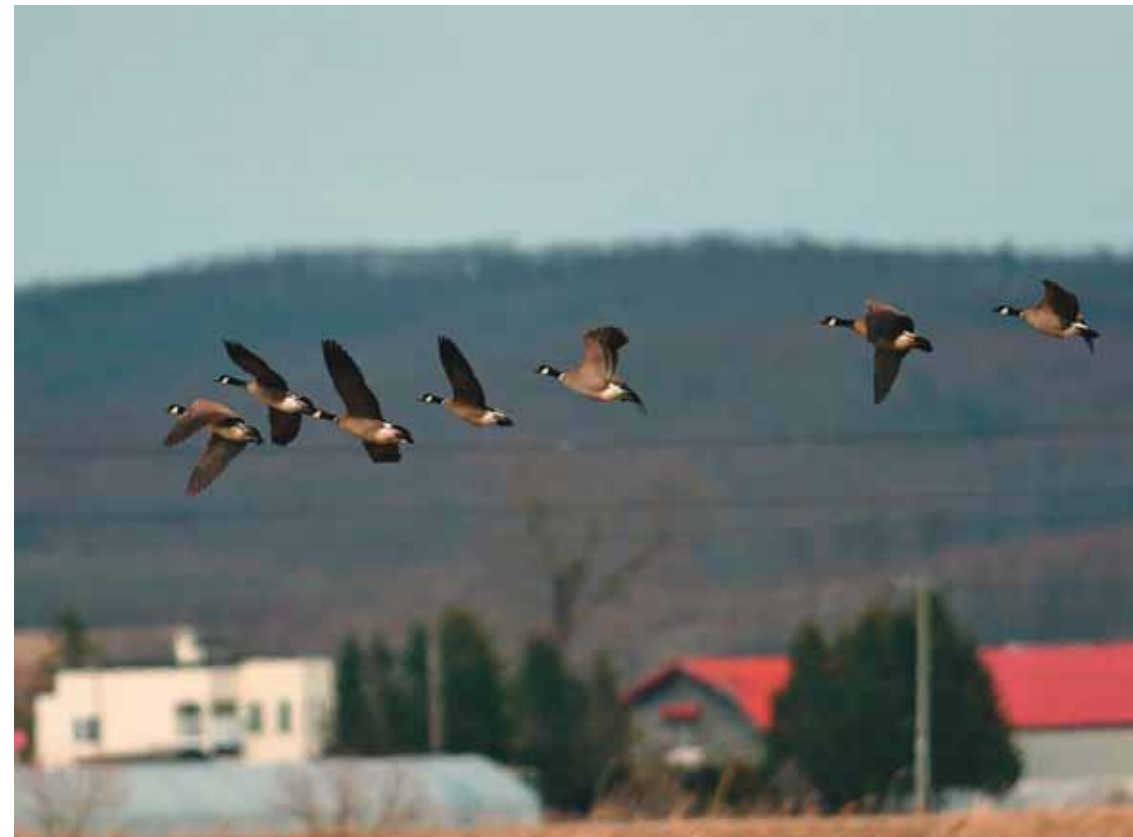
И они таки возвращаются. Япония, о-в Хонсю, 10 апреля 2007 г.

то моё заявление о готовности выполнить едва ли вообще выполнимое отнюдь не опиралось на разум, на трезвые расчёты. Но было огромное желание сделать это, уверенность в своих силах и возможностях, настоящая вера в исполнимость заявленного. Далёкий от политики, мог ли я знать, что живу реалиями, которые в те дни уходили в невозвратную для нынешних поколений историю. И, конечно же, ни я, ни мои коллеги не могли представить тогда глубину пропасти, на краю которой скоро мы, исполнители этой авантюры, окажемся.