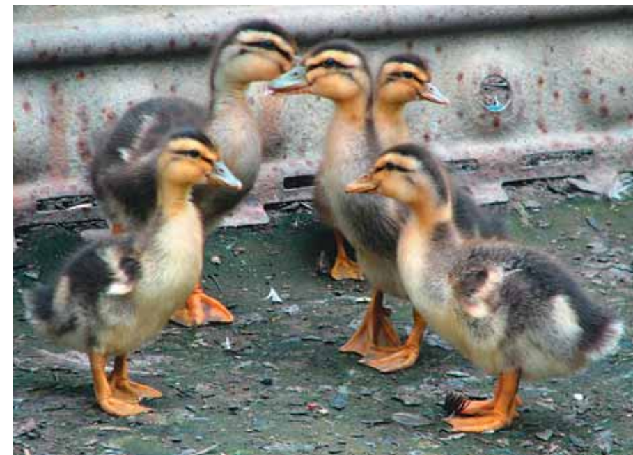
Они в растерянности: куда бежать?

С десяток же её яиц, по одному, мы разложили в гнёзда казарок. Так у нас появились шесть маленьких утят-подкидышей. Наблюдать за ними было, как говорится, «и смех и грех». В первые дни малыши были один в один утятами кряквы, а казарки-самки, похоже, не отличали их от своих родных детей. Но в двух семьях более внимательными оказались самцы, и стоило подкидышу появиться рядом с неродным папашей, тот сразу же пытался достать подозрительного «уродца» своим клювом. Но ещё больше поражала реакция «нелюбимых приёмых»: они моментально поняли, что «им здесь не рады». Один из «нелюбимых» постоянно держался в стороне от казарчат, другой вообще нашёл для себя укрытие за ванной, и до поры его не могли обнаружить в вольере даже мы. Эта самая «пора» для приёмых наступала с появлением в вольере очередной порции корма. Тот и другой пулей подлетали к выложенному корму, с жадностью выхватывали из него кусочки варёного яйца, после чего также стремительно убегали обратно. Не менее расторопными были утята и в других гусиных семьях: их любовь к яйцам и торопливая жадность оставляли