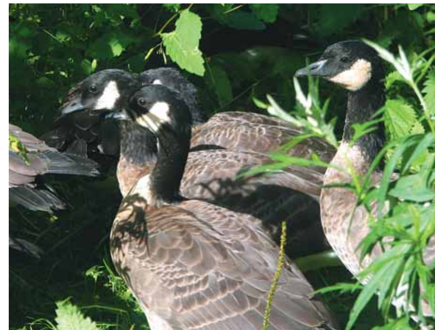
Островная растительность и кормит, и защищает этих птиц

На беду гусей, мясо их пришлось по вкусу мореходам. Люди убивали их без меры, ловить беззащитных птиц помогали привезённые на судах собаки. Уходя с островов, промышленники заготавливали «гусятину» впрок. Часть российского люда, а с ними и собаки оставались на островах на