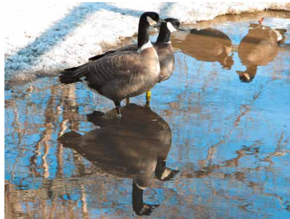
От стаи одна за другой отделяются пары

В третьей декаде марта гуси расходятся по территории питомника всё шире. К концу месяца некоторые пары уже пытаются