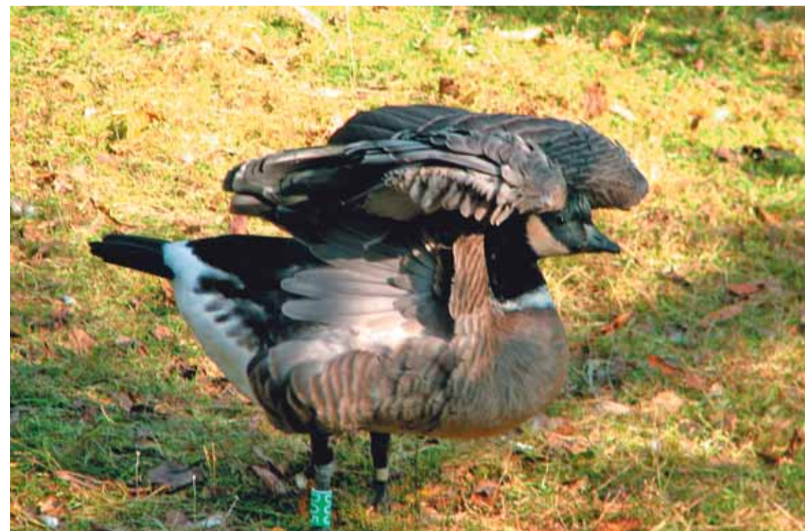
Как бы ей хотелось подняться в небо