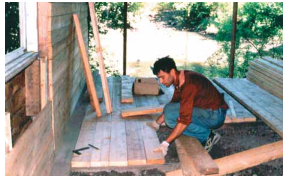
Строится «вторая очередь» зимника

— Коллеги, давайте объединим наши возможности: ваши птицы и ваши деньги, наши птицы и наша работа. Выпускать гусей будем в местах их бывшего обитания. Этот проект мы сделаем вместе. Только вместе.