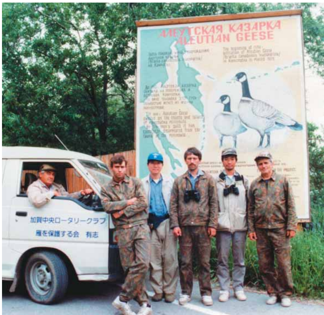
Мы начинали это вместе, середина 1990-х годов

Здесь моя дневниковая запись от 15 января 2008 года: «Сейчас, оглядываясь назад, я понимаю, в какую авантюру в том далёком 1989 году вверг не только себя, но и многих поверивших в меня людей. И