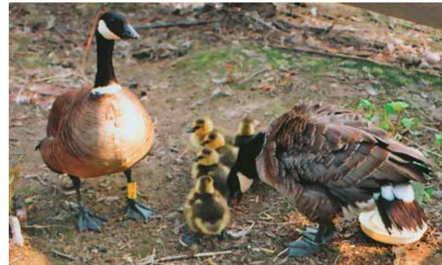
Семья 71—72. Самка (справа) демонстрирует недовольство нашим появлением в вольере, а самец спокоен

В период размножения на активную защиту своей «вотчины» готовы практически все самцы стаи. Часто они с таким остервенением набрасываются на мнимого агрессора, что, едва задав корм, освободив ванну от застоявшейся воды и успев-таки