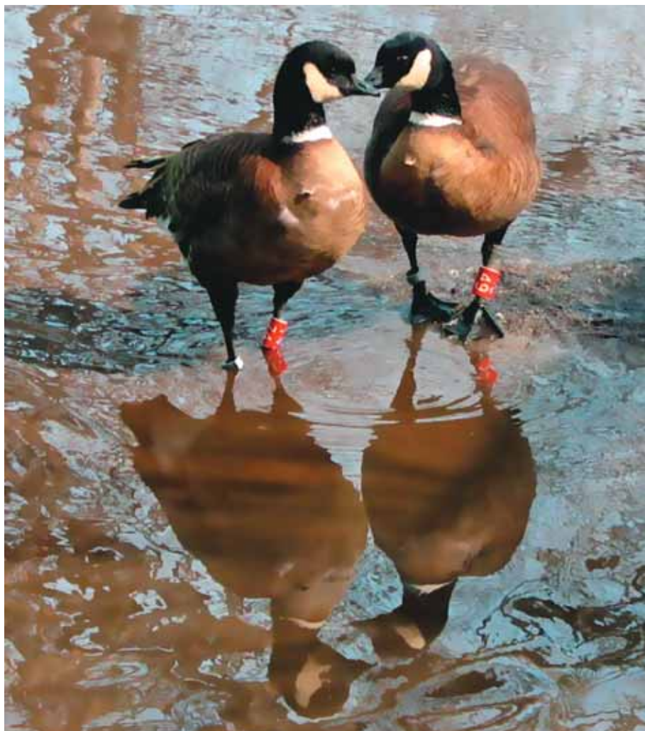
Последние дни марта и первое объяснение в любви

Год 2007-й. «Март нынешнего года с самого своего начала кажется действительно весенним: все дни конца первой недели, вся вторая неделя радуют плюсовой температурой. К середине месяца с нашей крыши, правда, только с солнечной стороны дома, свесились более трёх десятков сосулек, и некоторые из них длиной не менее метра. Во дворе уже несколько дней стоят небольшие лужи. Утром, перед выпуском гусей из зимника, я ломаю в них лёд, очищаю от льдин воду, и птицы, едва открывается дверь, сразу бегут к лужам купаться».