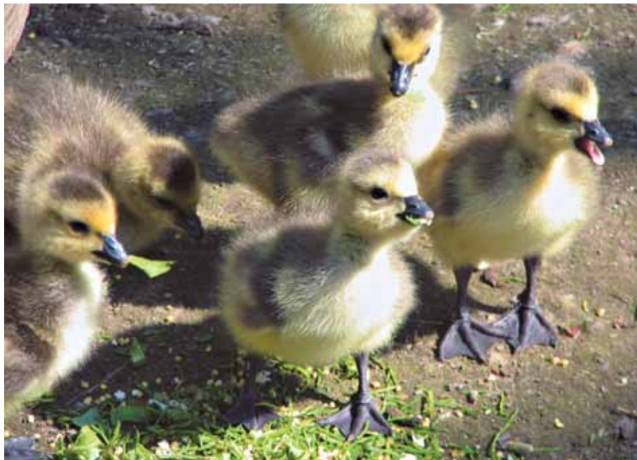
Им мы отдали годы своей жизни

какое-то время добавляется и ежедневный, иногда в течение дня неоднократный «медицинский осмотр» каждого выводка. Но об этом мы ещё скажем отдельно. И, не парадокс ли это, чем больше наши дети доставляют нам забот и печали, тем больше мы их любим. Но несравненно больше они приносят нам радости. Хорошо зная о том, что с первых часов жизни малышей заботы наши возрастают многократно, мы тем не менее каждый год с нетерпением ждем начала появления гусят на свет и хотим видеть их у себя всё в большем и большем числе.