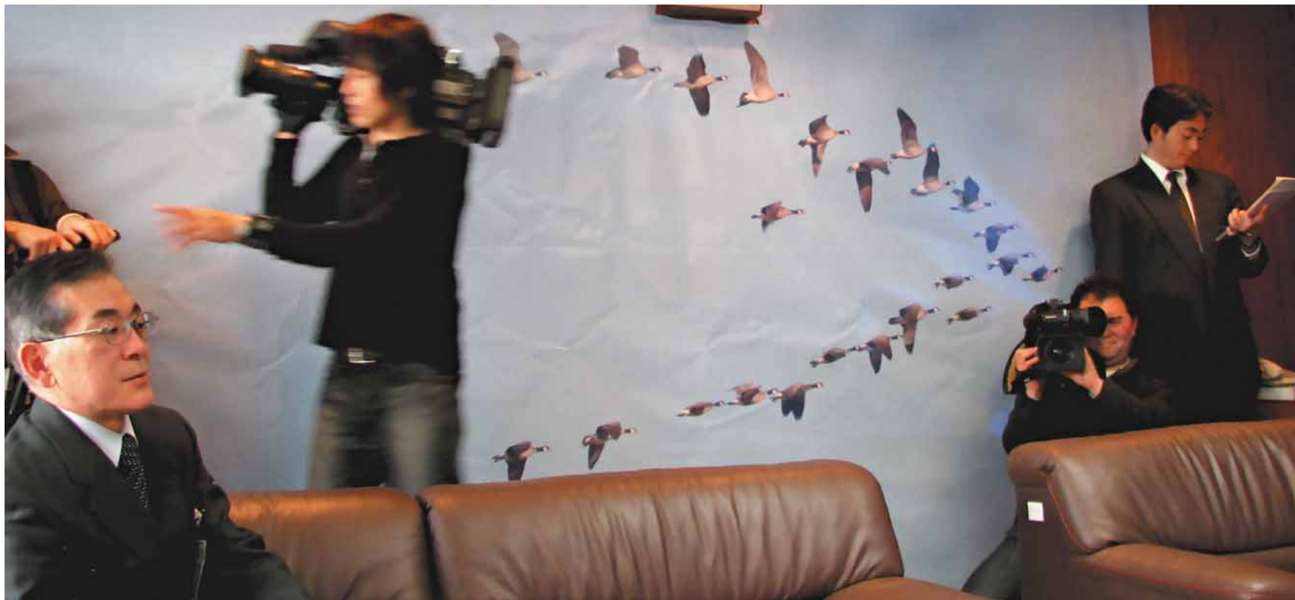
Приёмная мэрии, город Сендай, Япония, февраль 2008 года

на Курилы очередная партия птиц. И можно было с надеждой и нетерпением ждать хороших вестей от японских коллег.