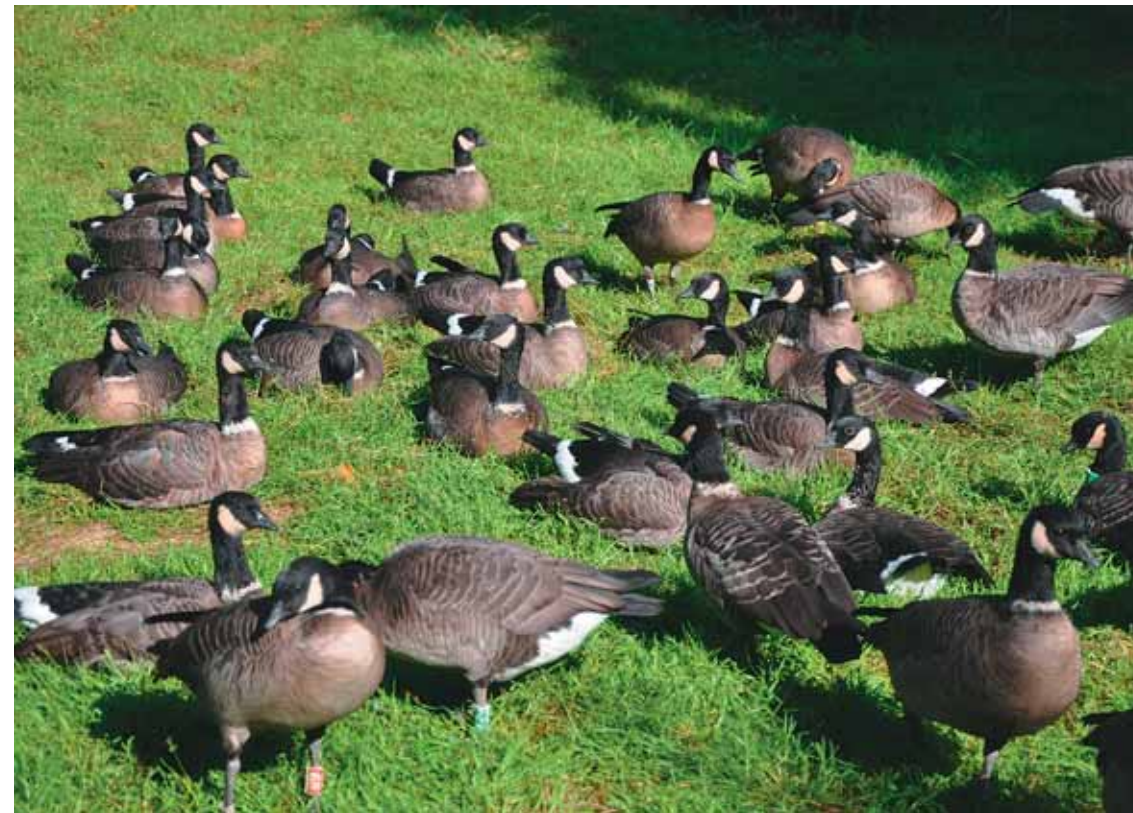
У казарок подрезаны крылья, им предоставлена относительная свобода

Нашим гусям этой осенью лететь куда не предстоит, на одном крыле у них подрезаны маховые перья, но они, похоже, с этим ещё не смирились. Казарки вдруг начинают «лететь» по территории всей стаей. Конечно же, это всего лишь бег с частыми взмахами не способных к полёту крыльев. Иногда спокойно кормящаяся до того на траве стая вдруг, будто чем-то испуганная, вся враз взрывается взметнувшимися вверх веерами крыльев. Точь-точно так же взрывоподобно взлетали испуганные тихоокеанскими орланами — Haliaeetus pelagicus чёрные казарки —