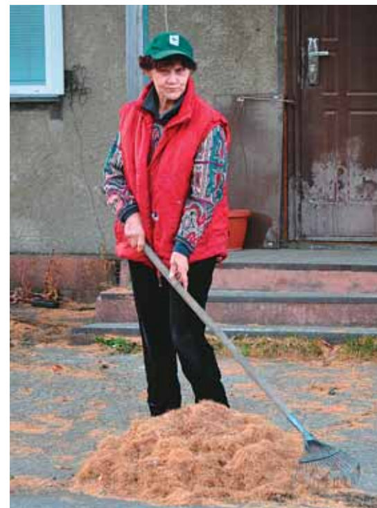
Сбор лиственничной хвои