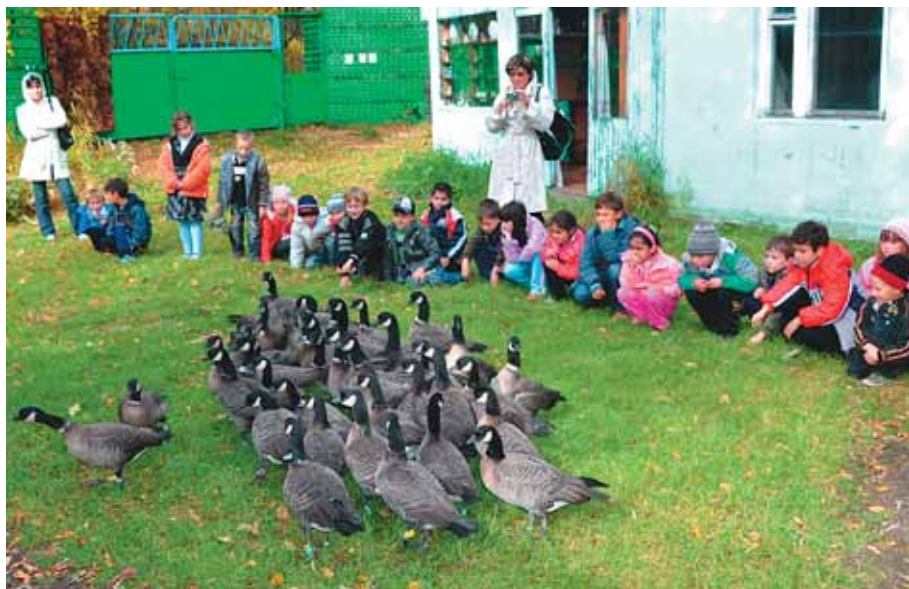
Дети — наши постоянные гости

лись через спутниковую связь. А совсем недавно видеозапись интервью с нами велась на совсем уж экзотическом валлийском языке.