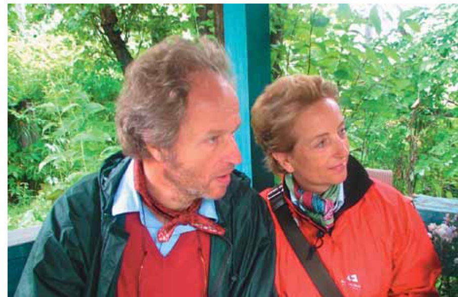
Посещали питомник и особы княжеских кровей

В питомник зашла группа «в меру упитанных» посетителей. Все навеселе, и было видно, что день этих господ и без нас был насыщен одними удовольствиями.