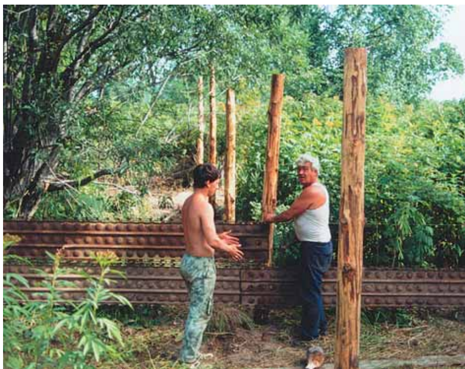
Закладывается вольерный комплекс

скал всю давно уже идеально очищенную от бывшего изобилия территорию. На свалке набрал несколько кусков кем-то использованных и выброшенных ржавых труб, сложил их около ворот. В питомник зашёл главный инженер.