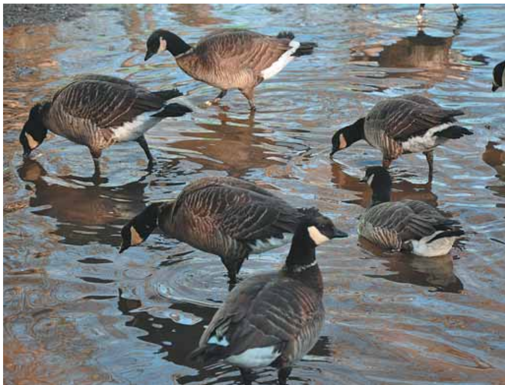
В марте, на радость гусям, в нашей «прихожей» образуются лужи