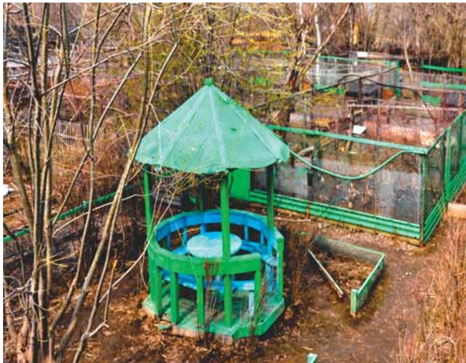
Фрагмент территории питомника в третьей декаде мая

не хотим их торопить, они ещё могут самостоятельно, без нашей помощи создать настоящие пары и иметь в этом году детей. И вот уже видим, что припозднившийся с подбором подруги молодой самец-двухлеток начинает демонстративно опекать родившуюся в прошлом году самочку, отгоняет от избранницы мнимых соперников. Скорее всего, подтолкнуло его к этому бурное кипение страстей у пар, находящихся в вольерах. А вот самочка, нам это хорошо заметно, не очень-то к нему и расположена: для создания семьи она ещё молода и созреет для полноценного брака, в самом лучшем случае, ещё через год. И ни она, ни её поклонник не знают того, что уже в конце нынешнего лета ей предстоит узнать, что такое настоящая свобода. Казарочку, это уже решено, через три месяца мы выпустим на волю.