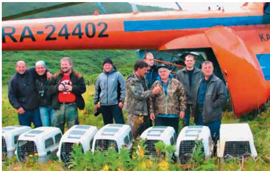
Это тоже год 2006-й, но уже сентябрь

шей победой, и первые бокалы при проходах уходящего 1997 года мы подняли за этот успех, за наших казарочек.