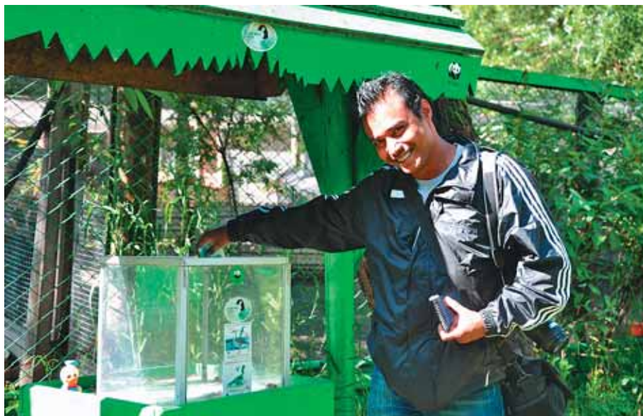
Гость из Индии