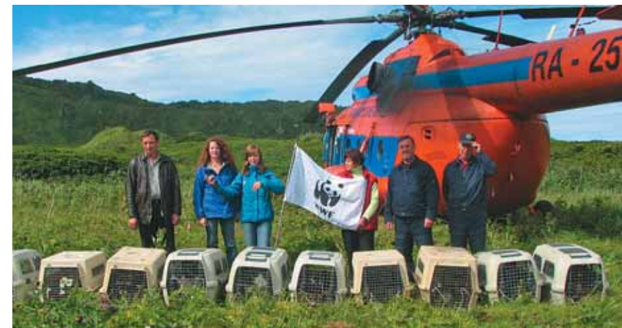
Экарма, год 2005-й

А в последний день этого года мы получили самый драгоценный новогодний подарок — сообщение о прилёте в Японию четырёх наших птиц! Это стало первой на-