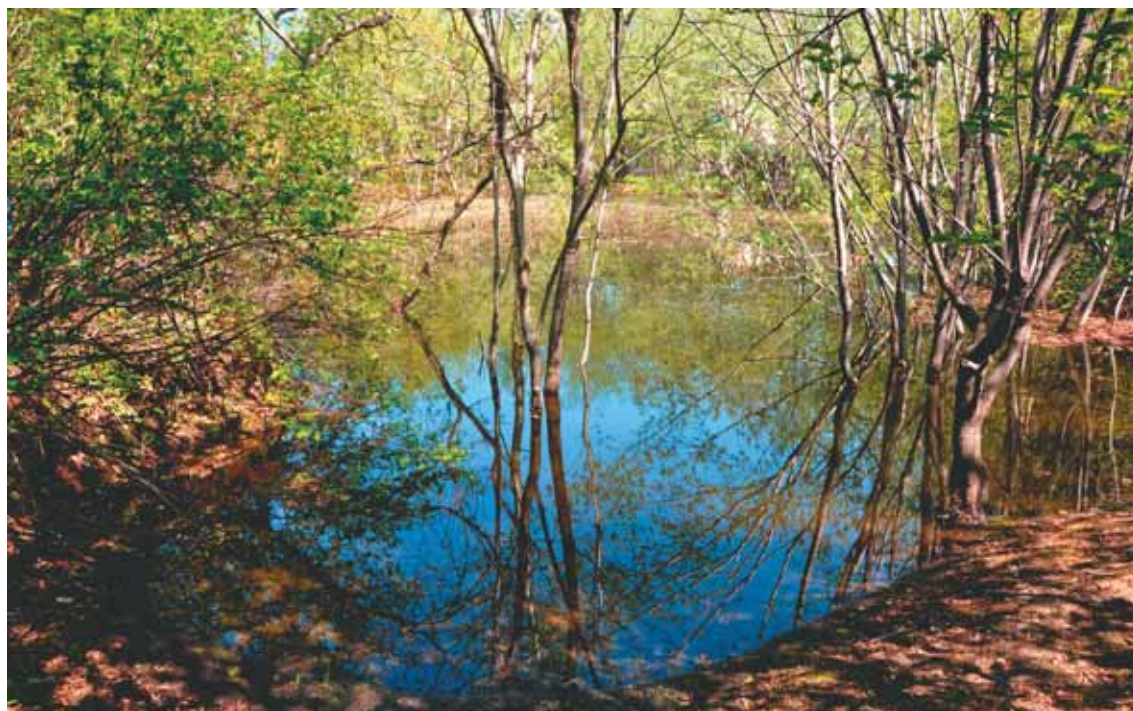
Фрагмент озёрной части территории питомника

Когда только-только были закопаны те первые три столба, а место будущих вольеров ещё находилось в абсолютной власти шиповниковых джунглей, девушка-гид привела к нам троих немецких туристов — любителей птиц: руководителя одной из европейских ассоциаций защиты хищных птиц, его жену и товарища. Все с тех пор прошедшие годы я очень сожалел, что не взял тогда у них визитных карточек. Стоя около сплошных зарослей шиповника, я буквально «на пальцах» рассказал гостям о том, что и ради чего здесь скоро будет. Гости видели и понимали, что я делился с ними всего лишь своими грёзами, но, очевидно, мой рассказ был очень убедителен — коллега достал из кармана две банкноты по 500 немецких марок и протянул их мне.